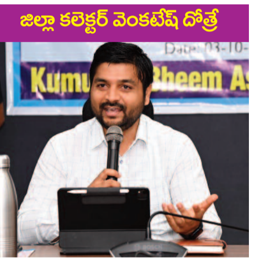
పాధ్యాయులుగా ఎంపికైనందున ఏర్పడిన ఖాళీలతో పాటు క్యారీ ఫార్వర్డ్ ఖాళీలు త్వరలో నోటిఫికేషన్ ద్వారా నింపేందుకు చర్యలు తీసుకోవడం జరుగుతుందని తెలిపారు.

ఉద్యమ కెరటం, అనిపాబాద్: ప్రజా పాలన ప్రజా విజయోత్సవాలలో భాగంగా జిల్లాలో చేపట్టనున్న కార్యక్రమాలను అధికారులు సమన్వయంతో కృషి చేసి విజయవంతం చేయాలని జిల్లా కలెక్టర్ వెంకటేష్ దోత్రే ఒక ప్రకటనలో తెలిపారు. డిసెంబర్ ఒకటవ తేదీన విజయోత్సవాలలో భాగంగా జిల్లాలోని 739 పాఠశాలలలో సంబంధిత మండల విద్యాధికారుల ద్వారా వ్యాసరచన పోటీలు నిర్వహించడం జరుగుతుందని తెలిపారు. జిల్లాలోని ప్రభుత్వ పాఠశాలలలో ప్రాథమిక మౌలిక సదుపాయాలను బలోపేతం చేసేందుకు ప్రభుత్వం అమ్మ అదర్స్ పాఠశాలల పథకం ద్వారా జిల్లాలోని 739 పాఠశాలలకు గాను 446 పాఠశాలలలో 17 కోట్ల 74 లక్షల రూపాయల నిధులతో పనులు చేపట్టి 90 శాతం పూర్తి చేయడం జరిగిందని తెలిపారు. కస్తూరిబా గాంధీ బాలికల విద్యాలయాలలో ఒప్పంద పద్ధతిన 58 ఉపాధ్యాయ ఖాళీలలో 28 భర్తీ చేయడం జరిగిందని, డి. ఎస్. సి. ద్వారా కస్తూరిబా గాంధీ బాలికల విద్యాలయాలలో పని చేయమన్న వారు రెగ్యులర్ ఉ