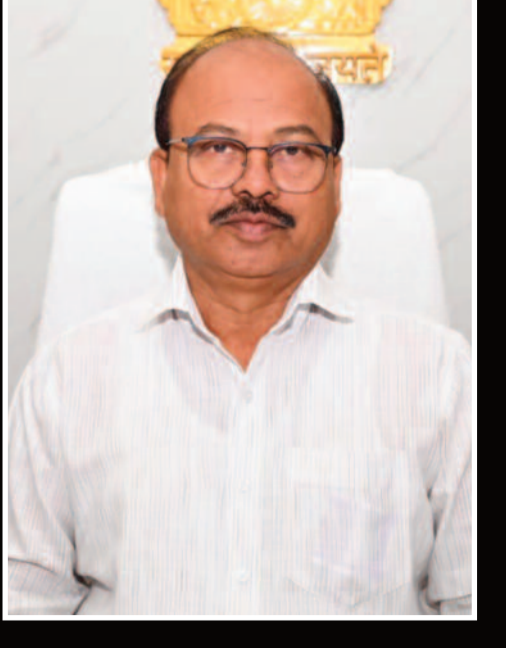
ఉద్యమ కెరటం అధ్యక్షుడు