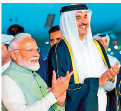
మార్చిలో భారత్ లో పర్యటించారని విదేశీ వ్యవహార శాఖ తెలిపింది.

న్యూఢిల్లీ, ఫిబ్రవరి 17: ప్రధానమంత్రి నరేంద్రమోదీ ఆహ్వానం మేరకు ఖతర్ పాలకుడు (అమిర్) షేక్ తమీమ్ బిన్ హమద్ అల్ థాని రెండు రోజుల అధికారిక పర్యటన నిమిత్తం సోమవారం భారత్ కు విచ్చేశారు. ఈ సందర్భంగా ఆయనకు అరుదైన గౌరవం లభించింది. ప్రధానమంత్రి నరేంద్రమోదీ స్వయంగా విమానాశ్రయానికి వెళ్లి షేక్ తమీమ్ కు స్వాగతం పలికారు. "నా సోదరుడు, ఖతర్ దేశ పాలకుడు అయిన షేక్ తమీమ్ బిన్ హమద్ అల్ థాని స్వాగతం పలికేందుకు విమానాశ్రయానికి వెళ్లాను. ఆయన భారత పర్యటన సఫలం కావాలని కోరుకుంటున్నాను" అని మోదీ తన ఎక్స్ థాలో పేర్కొన్నారు. షేక్ తమీమ్ గతంలో 2015