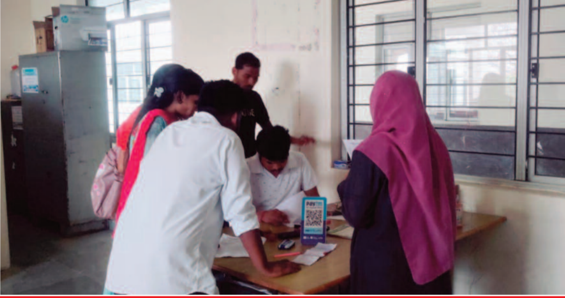
శనివారం కళాశాలలో విద్యార్థులకు హాల్ టికెట్లు అందజేత