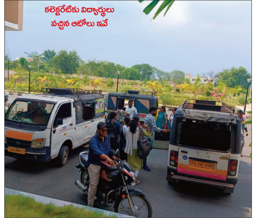
కలెక్టరేట్ కు విద్యార్థులు వచ్చిన ఆటోలు ఇవే