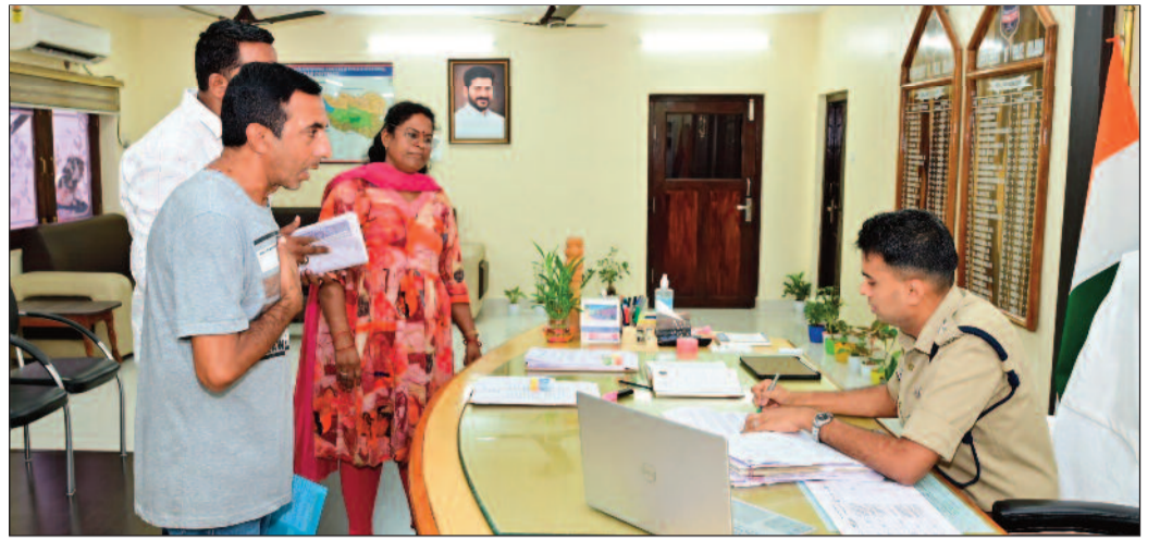
పోలీస్ యంత్రాంగాన్ని సంప్రదించాలని సూచించారు. అసాంఘిక కార్యకలాపాలపై నేరుగా ఎస్పీకి సమాచారం అందించాలంటే 8712659973 నెంబర్ కి వాట్సాప్ ద్వారా సంప్రదించవచ్చని తెలిపారు. నిర్భయంగా జిల్లా