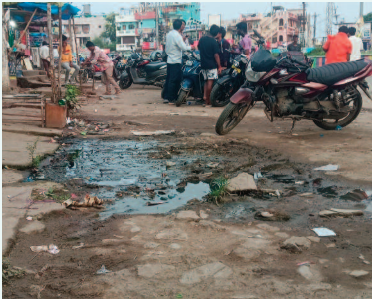
(ఉద్యమ కెరటం, ఆసిఫాబాద్ జిల్లా ప్రతినిధి)

కొమరం టీఎం ఆసిఫాబాద్ జిల్లాలోని పల్లెల్లో పారిశుధ్యం పడకేసింది. సర్పంచ్ పదవీకాలం ముగియడంతో ప్రస్తుతం గ్రామ పంచాయతీల్లో ప్రత్యేకాధికారుల పాలన కొనసాగుతోంది. ఒక్కో అధికారికి రెండు, మూడు గ్రామాల బాధ్యతలు ఉండడంతో పర్యవేక్షణ ఇబ్బందికరంగా మారింది. గ్రామాల్లో ఏమైనా సమస్యలున్నా చెప్పుదామంటే అధికారులు అందుబాటులో ఉండడం లేదని ప్రజలు ఆవేదన వ్యక్తం చేస్తున్నారు. జిల్లాలోని వాంకిడి, తిర్యాయి, కెరమేరీ, జైసూర్, సిర్పూర్(యు), లింగాపూర్, రెబ్బెన, పెంపికల్వేట్, దహాగాం, బెజూర్, కౌటాల, చింతలమానేపల్లి, సిర్పూర్(టి) మండలాల్లో ప్రత్యేకాధికారుల పాలనలో పారిశుధ్యం అధ్వాన్నంగా తయారైంది. గ్రామాలను పట్టించుకున్న నాథుడే కరువయ్యాడు. గ్రామాల్లో ఎక్కడ చూసిన చెత్తాచెదారం పేరుకుపోయింది. గ్రామపంచాయతీలలో రోడ్లపైనే మురికి నీరు ప్రవహిస్తుండడం వల్ల ప్రజలు తీవ్ర ఇబ్బందులు ఎదుర్కొంటున్నారు. జిల్లాలోని కొన్ని గ్రామపంచాయతీలలో మురికి నీరు రోడ్లపై చేరడంతో రాకపోకలకు ప్రజలు ఇబ్బందులకు గురి అవుతున్నారు. అదేవిధంగా కొన్ని గ్రామపంచాయతీలలో మురికి పూడికతీత నెలలు గడుస్తున్నప్పటికీనీ తీయకపోవడంతో విపరీతంగా డోములు పెరిగిపోయి సీజనల్ వ్యాధులు ప్రబలుతున్నాయి. డోముల నివారణకు ఫాంగ్స్ చేయాల్సిన అధికారులు ఇప్పటికీ కూడా కొన్ని గ్రామ పంచాయతీలలో ఫాంగ్స్ చేయలేదని ప్రజలు ఆరోపిస్తున్నారు. దీంతో ప్రజలు నానా అవస్థలు