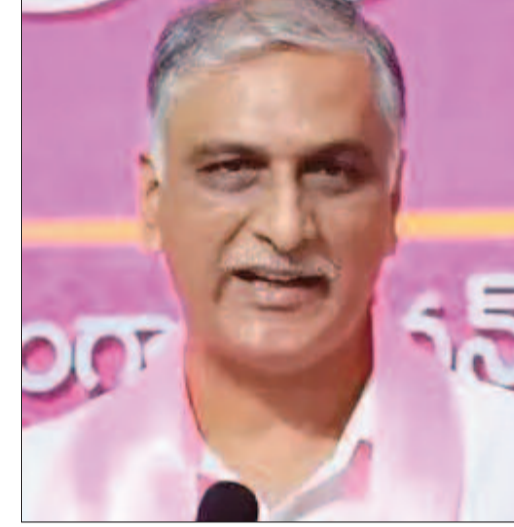
విరాజిల్లింది తెలంగాణ. తెలంగాణను అస్సంగిన్నాగా దేశానికే ఆదర్శంగా నిలిపింది కేసీఆర్. ఆత్మహత్యలు తెలంగాణను, అన్నపూర్ణగా మార్చింది కేసీఆర్. కేసీఆర్ పాలన గురించి నోరు పారేసుకునే వారికి ఇది చెంపపెట్టు సమాధానం. కేసీఆర్ కు రైతుకు ఉన్నది పేగు బంధం, ఆత్మ బంధం అయితే.. కాంగ్రెస్ కు ఉన్నది కేవలం ఓటు బంధం.' అని ఎక్స్ వేదికగా ట్వీట్ చేశారు.

ఆత్మహత్యల్లో రెండో స్థానంలో ఉన్న తెలంగాణ నేడు 14 వ స్థానిక పరిమితం. 2023లో దేశవ్యాప్తంగా 10,786 మంది రైతులు ఆత్మహత్యలు చేసుకోగా అందులో తెలంగాణ వాటా కేవలం 0.51 శాతం. 10 ఏండ్ల బీఆర్ఎస్ పాలనలో అన్నదాతల ఆత్మహత్యలు రికార్డు స్థాయిలో 95.84 శాతం తగ్గడం. ఇవి మాటలు కాదు, కేసీఆర్ తిరగరాసిన రికార్డులు, కేంద్ర ప్రభుత్వ లెక్కలు చెబుతున్న వాస్తవాలు అన్నారు. రైతును రాజు చేయాలన్న కేసీఆర్ సంకల్పానికి, వారు చేసిన నిర్విరామ కృషికి వచ్చిన ఫలితం అన్నారు. స్వరాష్ట్రంలో ఒక్కో పథకంతో వ్యవసాయరంగానికి జీవం పోశారు. సాగును బాగు చేశారు. రుణమాఫీతో రైతుకు ధీమా దొరికింది. రైతు బంధు బంధువు అయ్యింది. రైతు బీమా కొండంత భరోసా ఇచ్చింది. 24 గంటల ఉచిత విద్యుత్తు వెలుగులు నింపింది. పంట కొనుగోళ్లతో ప్రోత్సాహం అందింది. కాశీశ్వరం ప్రాజెక్టుతో సాగునీటి గోస తీరింది. మిషన్ కాకతీయతో చెరువుల పునరుద్ధరణ జరిగింది. భూగర్భ జలాలు ఉబికి బీడు భూములను పంట పొలాలుగా మార్చింది. ఉమ్మడి పాలనలో నిత్య దుర్భిక్షం, సాగు విధ్వంసం, వలసల దురవస్థ, ఆత్మహత్యల దౌర్భాగ్యం.. తెలంగాణ. స్వరాష్ట్రంలో సాగునీటి ప్రాజెక్టులతో సుజలమై, ధాన్యపురాకులతో సుషలమై, సాగుభూమి సస్యశ్యామ లమై.. కేసీఆర్ పాలనలో