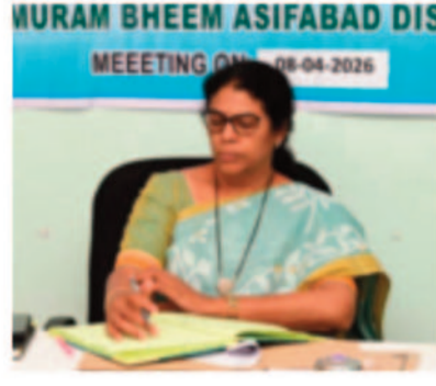
విధాన పరిషత్ ఆసుపత్రి నుండి ప్రభుత్వ ఆసుపత్రిగా మార్చి 50 పడకల నుండి 330 పడకలకు ఆసుపత్రి సామర్థ్యాన్ని పెంపొందించడం జరిగిందని, తదన గుణంగా సిబ్బంది నియామకం, వైద్య పరి