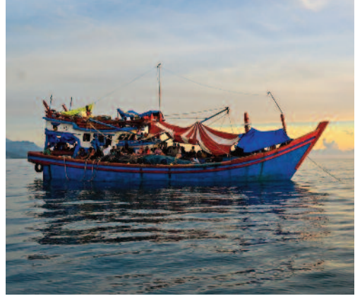
మలేసియా వెళ్తుండగా బలమైన ఈదురుగాలులు,

ధాకా, ఏప్రిల్ 15: అండమాన్ తీర సముద్రంలో ఘోర ప్రమాదం చోటుచేసుకుంది. రోహింగాల శరణార్థులు, బంగ్లాదేశ్ పౌరులతో వెళ్తున్న ఓ పడవ మునిగిపోయింది. ఘటనలో దాదాపు 250 మంది గల్లంతుయ్యారు. వారి కోసం సముద్రంలో ముమ్మరంగా గాలింపు చర్చలు కొనసాగుతున్నాయి. గల్లంతున వారిలో చిన్నవారూ కూడా ఉన్నారు. ఈ ప్రమాదంపై బక్రరాజ్యసమితి శరణార్థుల హైకమిషన్, ఇంటర్నేషనల్ ఆర్గనైజేషన్ ఫర్ మైగ్రేషన్ సంయుక్త ప్రకటన విడుదల చేసింది. ఈ పడవ దక్షిణ బంగ్లాదేశ్ లో బేకనాఫ్ ప్రాంతం నుంచి బయల్దేరినట్లు ఈ ప్రకటనలో ఐరాస అధికారులు పేర్కొన్నారు.