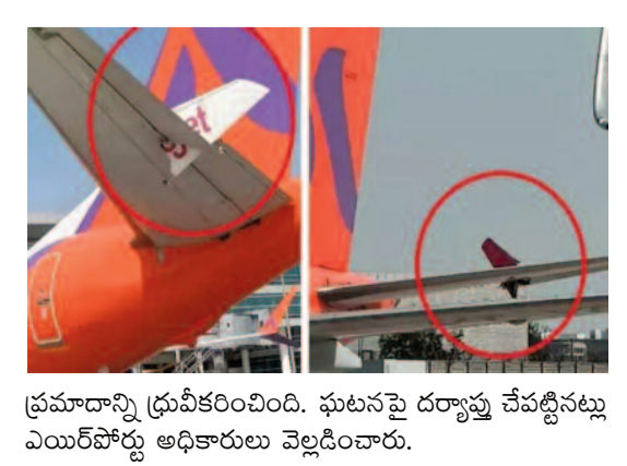
ప్రమాదాన్ని ధ్రువీకరించింది. ఘటనపై దర్యాప్తు చేపట్టినట్లు ఎయిర్పోర్టు అధికారులు వెల్లడించారు.

సురక్షితంగా ఉన్నట్లు విమానాశ్రయ అధికారులు వెల్లడించారు. ధిల్లి నుంచి హైదరాబాద్ బయల్దేరేందుకు ఆకాశ ఎయిర్ విమానం రన్ వేపై ఉంది. అదే సమయంలో పార్సింగ్ వైపు ప్రయాణిస్తున్న పైన్ జెట్ విమానం.. ఆకాశ విమానాన్ని పక్కనుంచి తాకుతూ వెళ్లింది. ఈ ప్రమాదంలో పైన్ జెట్ కుడివైపు రెక్క భాగం ధ్వంసమవుతోంది. ఆకాశ ఎయిర్ విమానం ఎడమవైపు భాగం స్వల్పంగా దెబ్బతింది. ప్రమాదంపై ఆకాశ ఎయిర్ అధికార ప్రతినిధి స్పందించారు. ఈ ఘటనతో ప్రయాణికులు, సిబ్బందిని వెంటనే విమానం నుంచి కిందకు దింపారు. వారి భద్రత మా ప్రధమ ప్రాధాన్యం. ప్రయాణికులను హైదరాబాద్ వంపించేందుకు ప్రత్యామ్నాయ ఏర్పాట్లు చేస్తున్నాం అని వెల్లడించారు. అటు పైన్ జెట్ కూడా