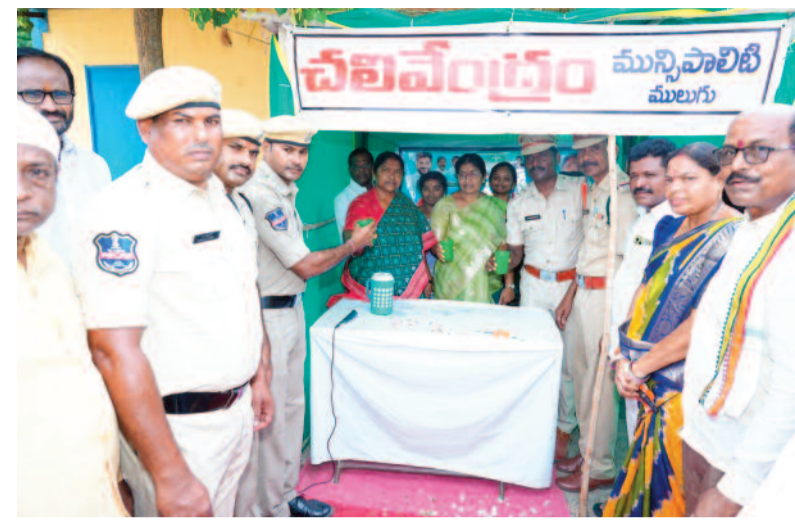
నేపథ్యంలో ములుగు మున్సిపాలిటీ చలివేంద్రాలు ఏర్పాటు చేయడం ఆదేశించిన ఆధ్వర్యంలో వార్డులు, ప్రధాన కూడళ్లలో దనీయమని కొనియాడారు. పోలీస్ హెడ్

ఉద్యమ కెరటం, ములుగు: వేసవిలో ప్రజల దాహార్తి తీర్చే చలివేంద్రాలు ఎంతో అవసరమని రాష్ట్ర పంచాయతీ రాజ్, గ్రామీణాభివృద్ధి, మహిళా శిశు సంక్షేమ శాఖ మంత్రి దనసరి అనసూయ (సీతక్క) అన్నారు. ములుగు జిల్లా కేంద్రంలోని పోలీస్ హెడ్ క్వార్టర్స్ ములుగు మున్సిపాలిటీ అధ్యక్షులలో ఏర్పాటు చేసిన చలివేంద్రాన్ని సోమవారం రిచైన్ కట్ చేసి ప్రారంభించారు. ఈ సందర్భంగా మంత్రి సీతక్క మాట్లాడుతూ వేసవి కాలంలో ఎండలు తీవ్రంగా ఉన్న