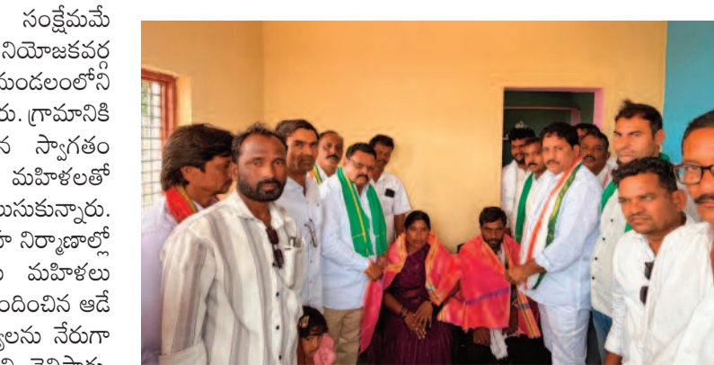
గ్రామంలో సూతనంగా నిర్మించిన ఇందిరమ్మ ఇళ్ల ఇచ్చారు. ఈ కార్యక్రమంలో స్థానిక కాంగ్రెస్ పార్టీ గృహప్రవేశ కార్యక్రమంలో ముఖ్య అతిథిగా పాల్గొన్నారు. నాయకులు, కార్యకర్తలు, గ్రామస్థులు పాల్గొన్నారు.