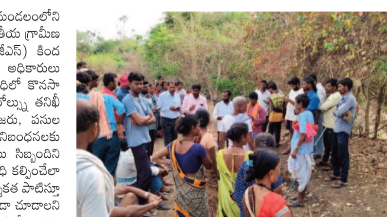
చలువ పందిళ్లు ఏర్పాటు చేయాలని, తాగునీటి సౌకర్యం కల్పించాలని కోరారు. గత కొన్ని వారాలుగా పెండింగ్

ఉద్యమ కెరటం, నేరడిగోండ: మండలంలోని బొరిగాం గ్రామంలో మహాత్మా గాంధీ జాతీయ గ్రామీణ ఉపాధి హామీ పథకం (ఎంఎన్ఆర్ఈజీఎస్) కింద జరుగుతున్న పనులను సోమవారం అధికారులు క్షేత్రస్థాయిలో పరిశీలించారు. గ్రామ పరిధిలో కొనసాగుతున్న పనులను పర్యవేక్షిస్తూ మస్టర్ రోల్స్ను తనిఖీ చేశారు. పనుల నాణ్యత, కూలీల హాజరు, పనుల పురోగతిని సమగ్రంగా పరిశీలించి నిబంధనలకు అనుగుణంగా నిర్వహించాలని క్షేత్రస్థాయి సిబ్బందిని ఆదేశించారు. అర్హత ప్రతిఙ్కరిత ఉపాధి కల్పించేలా చర్యలు తీసుకోవాలని, అమలులో పారదర్శకత పాటిస్తూ కూలీలకు ఎలాంటి ఇబ్బందులు తలెత్తకుండా చూడాలని సూచించారు. పనుల పరిశీలన అనంతరం కూలీలు తమ సమస్యలను అధికారుల దృష్టికి తీసుకెళ్లారు. ఎండలు తీవ్రంగా ఉన్న నేపథ్యంలో పని ప్రదేశాల్లో నీడ కోసం