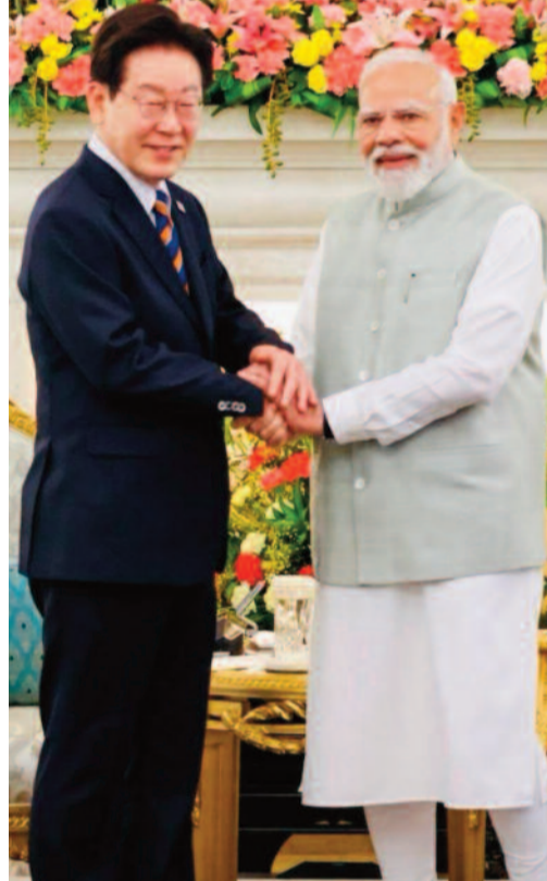
అలాగే ఇండో-పసిఫిక్ ప్రాంతంలో శాంతి, స్థిరత్వం కోసం రెండు దేశాలు కలిసి పనిచేస్తాయని మోదీ తెలిపారు.

న్యూఢిల్లీ, ఏప్రిల్ 20: భారత్, దక్షిణ కొరియా మధ్య ద్వైపాక్షిక సంబంధాలు మరింత బలపడుతున్నాయని ప్రధాని నరేంద్ర మోదీ అన్నారు. దక్షిణ కొరియా అధ్యక్షుడు లీ జే మ్యూంగ్ మూడు రోజుల పర్యటన కోసం భారత్ వచ్చారు. ఇరు దేశాల మధ్య సోమవారం పలు ఒప్పందాలు కుదిరాయి. అనంతరం నిర్వహించిన సంయుక్త మీడియా సమావేశంలో ప్రధాని మోదీ మాట్లాడారు. ఇరు దేశాల మధ్య ద్వైపాక్షిక సంబంధాల్లో ఇది కీలక ముందడుగు అని అన్నారు. భారత్, దక్షిణ కొరియా మధ్య సంబంధాలు కేవలం వాణిజ్యానికి మాత్రమే పరిమితం కాకుండా టెక్నాలజీ, రక్షణ, షిప్ బిల్డింగ్, ఎనర్జీ వంటి విభిన్న రంగాల్లో విస్తరిస్తున్నాయని ప్రధాని పేర్కొన్నారు. చిప్స్ నుంచి షిప్స్ వరకు, ట్యూలెంట్ నుంచి టెక్నాలజీ వరకు, ఎంటర్టైన్ మెంట్ నుంచి ఎనర్జీ వరకు.. ఇలా వివిధ రంగాల్లోని అవకాశాలను అందిపుచ్చుకునే విధంగా దక్షిణ కొరియాతో భాగస్వామ్యం చేసుకుంటున్నట్లు తెలిపారు. ప్రస్తుతం ఇరు దేశాల మధ్య సుమారు 27 బిలియన్ డాలర్ల గా ఉన్న వాణిజ్యాన్ని 2030 నాటికి 50 బిలియన్ డాలర్లకు పెంచేందుకు చర్యలు తీసుకుంటున్నట్లు ప్రధాని తెలిపారు. ఈ సమావేశంలో పలు కీలక ఒప్పందాలు కూడా కుదిరాయి. ముఖ్యంగా మిలీట్రామిక్ రంగం, టెక్నాలజీ, ఎనర్జీ, క్రీటికల్ మినరల్స్ వంటి రంగాల్లో వరసరంగం సహకరించుకునేందుకు ఇరు దేశాలు అంగీకరించాయి.