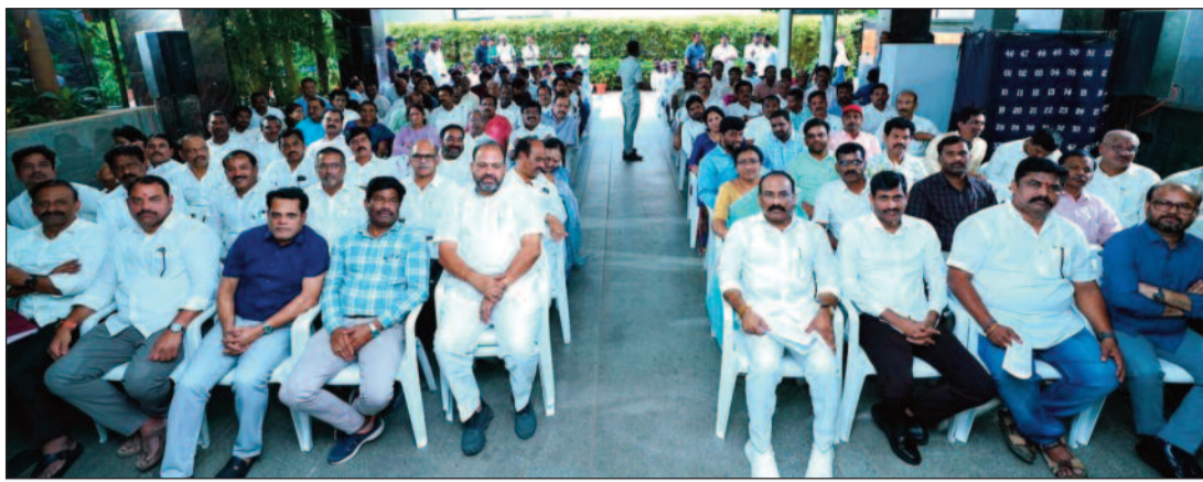
కార్కుల ప్రతిపాదనపైనా ప్రభుత్వం సానుకూలంగా స్పందించిందన్నారు. ఈ రెండేళ్ల ప్రజా ప్రభుత్వంలో 67,760 ఉద్యోగ నియామకాలు చేపట్టినట్లు ఆయన చెప్పుకొచ్చారు. 'ఇది డ్రాఫ్ట్ ప్రభుత్వం.. మీ సమస్యలను పరిష్కరించే బాధ్యత మాది' అంటూ సీఎం రేవంత్ రెడ్డి భరోసా కల్పించారు.

ప్రతి రెండు నెలలకోసారి గుర్తింపు సంఘాలు సమావేశమై సమస్యలపై ప్రభుత్వానికి రిపోర్టు అందించాలని పేర్కొన్నారు. ప్రభుత్వం ఏ పథకాన్ని ప్రకటించినా ఉద్యోగులు భుజాన వేసుకుని పని చేశారని ప్రశంసించారు. వారి సహకారంతోనే ప్రభుత్వ సంక్షేమ పథకాలను విజయవంతంగా అమలు చేయగలుగుతున్నామని కొనియాడారు. కాంగ్రెస్ ప్రభుత్వం అధికారంలోకి వచ్చిన వెంటనే ఉద్యోగుల కోసమే మొదటి నిర్ణయం తీసుకున్నామని గుర్తు చేశారు. ఉద్యోగులకు ప్రతి నెలా మొదటి తారీఖునే జీతాలు అందేలా చర్యలు చేపట్టినట్లు రేవంత్ రెడ్డి చెప్పుకొచ్చారు. ఉద్యోగ సంఘాలు స్వేచ్ఛగా ఎన్నికలు నిర్వహించుకునేలా అవకాశం కల్పించామన్నారు. ఉద్యోగుల బదిలీల విషయంలో గందరగోళం తలెత్తకుండా ప్రణాళిక ప్రకారం చేసినట్లు చెప్పుకొచ్చారు. ఎంతో కాలంగా పెండింగ్ లో ఉన్న టీడీపీ బదిలీలను ఎలాంటి వివాదం లేకుండా పూర్తి చేశామన్నారు. ఉద్యోగుల ఆరోగ్య భద్రతా