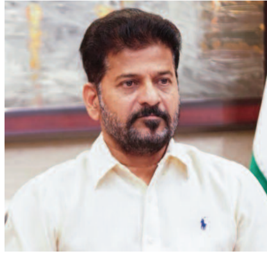
ధాన్యం లోడింగ్లో జాప్యం జరగకుండా స్టానికంగా ఉన్న హమాబీలను గుర్తించి వారితో పని చేయించుకోవాలని రేవంత్ తెలిపారు. ధాన్యం లోడ్ చేసిన వెంటనే రైతులకు రశీదు అందేలా చర్యలు తీసుకోవాలన్నారు. దగ్గరగా ఉన్న

కొనుగోలు కేంద్రాల్లో రైతులకు ఎలాంటి ఇబ్బందులు కలగకుండా చూడాలని సీఎం ఆదేశించారు. అధికారులు క్షేత్రస్థాయికి వెళ్లి కొనుగోళ్ల తీరును పరిశీలించాలని.. గన్లు బ్యాగులు, హమాబీల కొరత లేకుండా చూసుకోవాలని సూచించారు. కొనుగోలు చేసిన ధాన్యాన్ని ఎప్పటి కప్పుడు గోడౌన్స్ కు తరలించాలని అన్నారు. ధాన్యం తరలింపునకు అవసరమైన వాహనాలను అందుబాటులో ఉండేలా చూడాలని రవాణా శాఖ కమిషనరుకు ఆదేశాలు జారీ చేశారు. సమస్య తీవ్రతను గుర్తించి జిల్లా కలెక్టర్ల సరైన చర్యలు తీసుకోవాల్సింది అని.. ప్రతి అధికారి జవాబుదారీ తనంతో వ్యవహరించాల్సిందే అని తేల్చిచెప్పారు. నిర్లక్ష్యం వహిస్తే కలెక్టర్లపై చర్యలకు ప్రభుత్వం వెనకాడదని హెచ్చరించారు. గోడౌన్స్ సమస్య ఉన్న ప్రాంతాల్లో అవసరాన్నిబట్టి తాత్కాలిక ఏర్పాట్లు చేసుకోవాలని ముఖ్యమంత్రి సూచించారు. రైతుబజారు, ఫంక్షన్ హాల్స్ ను ఎంజీఓ చేసి ధాన్యాన్ని తరలించాలన్నారు. వెనులుబాటు ఆధారంగా అక్కడినుంచి గోడౌన్స్ కు తరలించేలా ప్రణాళికలుండాలని తెలిపారు. కొనుగోళ్లపై ఎప్పటికప్పుడు సీఎస్ కు పోర్ట్ పంపించాలని సీఎం రేవంత్ రెడ్డి ఆదేశించారు.