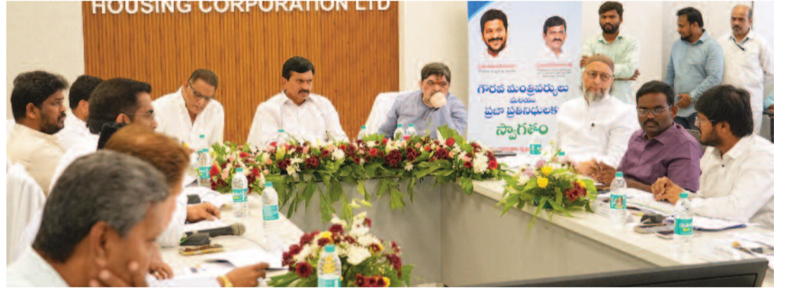
తీసుకుని స్థల సేకరణ చేయాలి" అని అధికారులకు సూచించారు. కాలిలో డ్రైనేజీ, మంచినీరు వంటి కనీస వసతుల కల్పనకు ప్రాధాన్యత ఇవ్వాలని ఆదేశించారు.

ఈ సందర్భంగా మంత్రి మాట్లాడుతూ.. రెండో విడత అమలుకు సంబంధించిన పూర్తి విధివిధానాలను ఈ నెల 21న జరిగే మంత్రివర్గ సమావేశంలో చర్చించి ఖరారు చేస్తామని తెలిపారు. గత ప్రభుత్వ హయాంలో నిర్మించిన డబుల్ బెడ్ రూమ్ ఇళ్ల పంపిణీలో జరుగుతున్న జాప్యంపై మంత్రి అసహనం వ్యక్తం చేశారు. పూర్తయిన ఇళ్లకు లబ్ధిదారులకు అప్లికేషన్లను తక్షణమే 'స్పెషల్ డ్రైవ్' నిర్వహించాలని అధికారులను ఆదేశించారు. ఈ నెలాఖరులోపు లబ్ధిదారుల గుర్తింపు ప్రక్రియ పూర్తి కావాలని స్పష్టం చేశారు. ముఖ్యంగా హైదరాబాద్ పరిధిలో సొంత స్థలాలు ఉండి, ఇల్లు లేని అర్హులకు ఈ నెల చివరలోనే మంజూరు పత్రాలు అందజేయాలని అధికారులకు డెడ్లైన్ విధించారు. గత ప్రభుత్వం నగరం నుంచి 30 కిలోమీటర్ల దూరంలో ఇళ్లు కట్టడం వల్ల పేదలు నివసించడానికి వెనుకాడుతున్నారని పొంగులేటి విమర్శించారు. "ప్రస్తుత ప్రభుత్వం ఆ తప్పు చేయదు. పేదవాడు నివసించే ప్రాంతానికి 5 నుండి 8 కిలోమీటర్ల పరిధిలోనే ఇళ్లు నిర్మించాలని నిర్ణయించాం. నియోజకవర్గాన్ని యూనిట్ గా