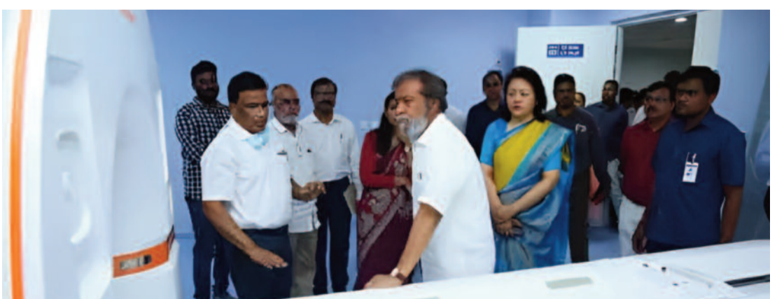
రూమ్స్, డయాగ్నోస్టిక్స్, ఇన్ పేషెంట్ వార్డులు, ఫార్మసీ తదితర ఏర్పాట్లను పరిశీలించిన మంత్రి.. రిజిస్ట్రేషన్ కౌంటర్లు, ఫార్మసీ కౌంటర్లు పెంచాలని మంత్రి సూచించారు. సీటీ స్కాన్, ఎంఆర్ఐ, ఎక్స్ రే, అల్ట్రాసౌండ్ తదితర యంత్రాలను పరిశీలించిన మంత్రి.. అద్యాన్స్ టెక్నాలజీతో అందుబాటులోకి తీసుకొచ్చిన ఈ యంత్రాల పూర్తిస్థాయిలో పేషెంట్లకు ఉపయోగపడాలని, ఇందుకు అవసరమైన డాక్టర్లు, ఇతర సిబ్బందిని నిర్ణయాత్మకంగా ఉంచుకోవాలని ఆరోగ్యశాఖ అధికారులను మంత్రి ఆదేశించారు. జూనియర్ సనత్ నగర్ టీమ్ ను ప్రారంభిస్తామని అన్నారు. ఇక్కడ సెన్సిఫికల్ వైద్య సేవల