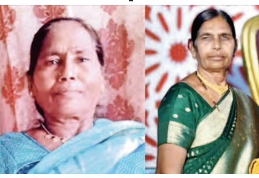
తాండూరు ప్రాంతానికి చెందిన అదృశ్యమైన ఇద్దరు వృద్ధ మహిళలుగా పోలీసులు ప్రాధమికంగా గుర్తించినట్లు సమాచారం. వీరి వయసు సుమారు 60 సంవత్సరాల

రంగారెడ్డి, మే 16: రంగారెడ్డి జిల్లా మొయినాబాద్ పరిధిలోని ఓ ఫామ్ హౌజ్ లో ఇద్దరు వృద్ధ మహిళలు హత్యకు గురైన ఘటన తీవ్ర కలకలం రేపింది. గుర్తుతెలియని వ్యక్తులు అత్యంత దారుణంగా హత్య చేసిన ఈ ఘటన స్థానికంగా భయాందోళనలకు గురిచేస్తోంది. సమాచారం అందుకున్న పోలీసులు వెంటనే ఘటనాస్థలికి చేరుకుని పరిశీలించారు. మృతదేహాలను స్వాధీనం చేసుకుని పోస్టుమార్టం నిమిత్తం ఆసుపత్రికి తరలించారు. హత్యకు గురైన మహిళలను