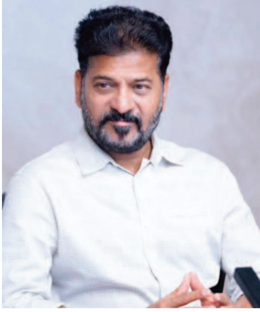
దేశంలో ఇలాంటి గడ్డు పరిస్థితులు ఉన్న తరుణంలో, అంతర్జాతీయంగా ఇరాన్ - ఇజ్రాయిల్ మధ్య జరుగుతున్న

ఆయన పేర్కొన్నారు. సరేంద్ర మోడి సారథ్యంలోని కేంద్ర ప్రభుత్వం తాజాగా తీసుకున్న పెట్రోల్, డీజిల్ ధరల పెంపు నిర్ణయం ఏ మాత్రం సమర్థనీయం కాదని సోషల్ మీడియా 'ఎక్స్' (ట్విట్టర్) వేదికగా సీఎం తీవ్ర అభ్యంతరం వ్యక్తం చేశారు. కేంద్ర ప్రభుత్వ అనాలోచిత నిర్ణయం దేశంలోని అనేక రంగాలపై తీవ్ర వ్యతిరేక ప్రభావం చూపుతుందని ఆయన ఆవేదన వ్యక్తం చేశారు. మోడి ప్రభుత్వ అసమర్థ పాలన, అనాలోచిత ఆర్థిక విధానాల కారణంగా దేశ ఆర్థిక వ్యవస్థ పూర్తిగా కుద్రలైందని ముఖ్యమంత్రి రేవంత్ రెడ్డి విమర్శించారు. కేంద్రం చెబుతున్న 'ఆత్మనిర్భర్ భారత్' కేవలం ఓట్లు రాల్చే నినాదమే తప్ప, క్షేత్రస్థాయిలో ఎలాంటి ఫలితాలు సాధించని పాలసీ అని ఇప్పుడిప్పుడే తేలిపోయిందని ఎద్దేవా చేశారు. కేంద్ర ప్రభుత్వ నిర్ణయాల వల్ల దేశంలో చిన్న, మధ్య తరహా పరిశ్రమలు దెబ్బతిన్నాయని, దేశీయ యువత ఉపాధికి గ్యారంటీ లేని దారుణ పరిస్థితి దాపురించిందని వ్యాఖ్యానించారు. అన్యదాతల ఆదాయాల రెడ్డింపు చేస్తూంటూ గతంలో ఇచ్చిన హామీ ఒడ్డి మాటానే మిగిలిపోయిందని మండిపడ్డారు. గత పదేళ్లుగా అంతర్జాతీయ మార్కెట్లో రూపాయి విలువ నిరంతరం పతనమవుతూ వస్తోందని, ఇప్పుడు ఆ పతనం పరాకాష్ఠకు చేరిందని ఆరోపించారు.