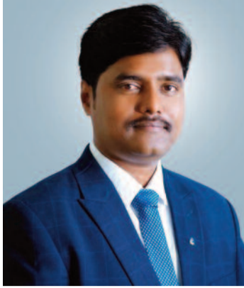
డాక్టర్ ముఖ్య వక్తగా హాజరై ప్రసంగించారు. భవితవ్య విద్యార్థులు