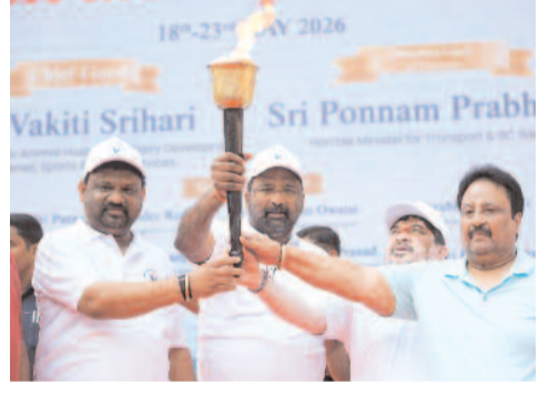
హైదరాబాద్, మే 18: ప్రజా పాలనలో భాగంగా రాష్ట్రవ్యాప్తంగా

ఎల్పి స్టేడియంలో మంత్రుల జంబా దాన్స్.. ఐదు కిలోమీటర్ల వాకథాన్ ప్రారంభం