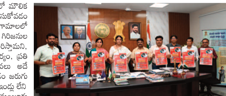
అధికారులు కార్యక్రమంలో గిరిజన సంక్షేమ శాఖ అధికారులు తదితరులు పాల్గొన్నారు.

భాగంగా గిరిజన గ్రామాలలో మౌలిక వసతుల కల్పనకు చర్యలు తీసుకోవడం జరుగుతుందని తెలిపారు. గ్రామాలలో రహదారి, త్రాగునీరు, గిరిజనల ఆరోగ్యంపై ప్రత్యేక దృష్టి సాగిస్తామని, ప్రతి ఇంటికీ విద్యుత్ సౌకర్యం, ప్రతి గ్రామానికీ ఇంటర్నెట్ సేవలు అదే విధంగా చర్యలు తీసుకోవడం జరుగుతుందని తెలిపారు. పక్కా ఇండ్ల లేని గిరిజనులకు గృహాలు మంజూరు చేస్తామని, గిరిజనుల అభివృద్ధికి సమన్వయంతో కృషి చేయాలని