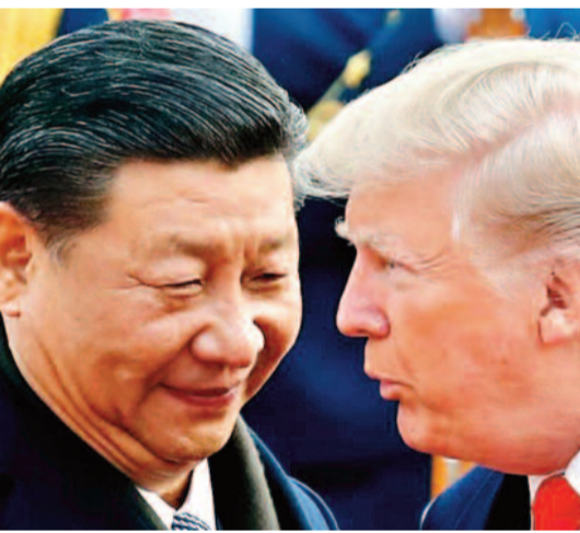
కొనసాగుతున్న వాణిజ్య యుద్ధం కారణంగా అమెరికా రైతులు తీవ్రంగా నష్టపోయారు. ఒకరిపై ఒకరు భారీ టారిఫ్లు విధించుకోవడంతో అమెరికా నుంచి చైనాకు జరిగే వ్యవసాయ

వాషింగ్టన్, మే 18: అంతర్జాతీయ వాణిజ్య రంగంలో మరో కీలక పరిణామం చోటుచేసుకుంది. అమెరికా అధ్యక్షుడు డొనాల్డ్ ట్రంప్, చైనా అధ్యక్షుడు షీ జిన్పింగ్ మధ్య ఇటీవల జరిగిన కీలక చర్చల అనంతరం వైట్ హౌస్ ఒక ముఖ్య ప్రకటన విడుదల చేసింది. దీని ప్రకారం.. చైనా వచ్చే మూడు సంవత్సరాల్లో అమెరికా నుంచి భారీ స్థాయిలో వ్యవసాయ ఉత్పత్తులను కొనుగోలు చేయడానికి అంగీకరించింది. ప్రతి ఏడాది కనీసం 17 బిలియన్ డాలర్ల విలువైన వ్యవసాయ ఉత్పత్తులను దిగుమతి చేసుకుంటామని చైనా హామీ ఇచ్చినట్లు వెల్లడించింది. భారత కరెన్సీలో ఇది సుమారు రూ.1.4 లక్షల కోట్లకు సమానం. 2026, 2027, 2028 సంవత్సరాల్లో ఈ కొనుగోళ్లు నిరంతరాయంగా కొనసాగునున్నట్లు వైట్ హౌస్ స్పష్టం చేసింది. గత ఏడాది ఆక్టోబర్లో సోయాబీన్ కొనుగోళ్లకు సంబంధించిన ఒప్పందాలు దీనికి అదనమని తెలిపింది. గత కొంతకాలంగా అమెరికా-చైనా మధ్య