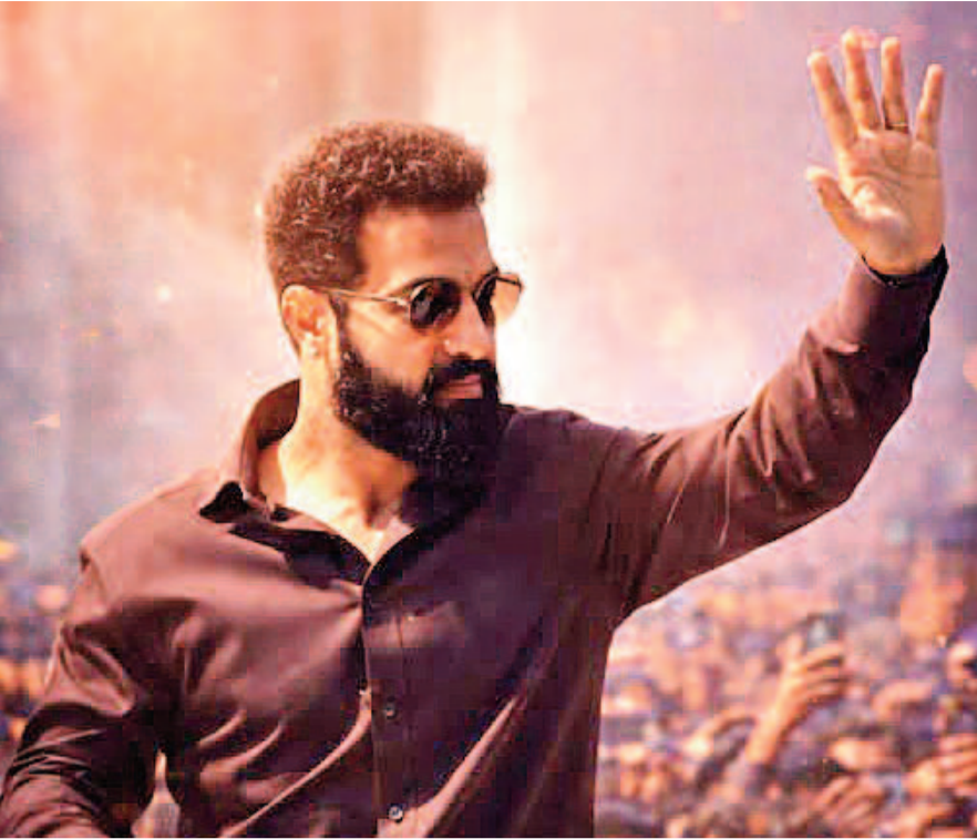
హైదరాబాద్, మే 19: బుల్లితెరపై తన ప్రత్యేకమైన కామెడీ టైమింగ్ తో ఎంతో మంచి అభిమానులను సంపాదించుకున్న సుడిగాలి సుధీర్ ఇప్పుడు హీరోగా వరుస సినిమాలతో ప్రేక్షకులను అలరించడానికి సిద్ధమవుతున్నారు.