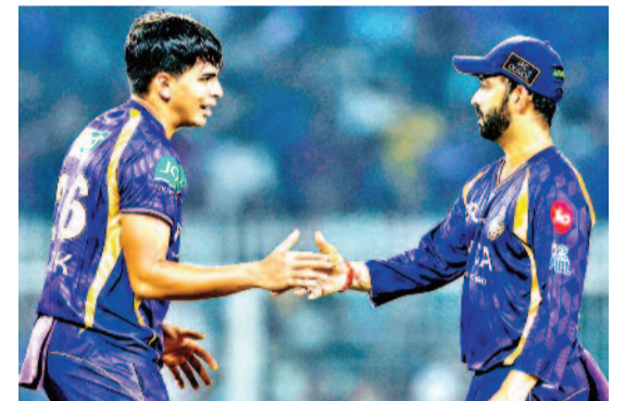
ప్లే ఆఫ్స్ ఆశలు సజీవం..

కోల్ కతా: ఈడెన్ గార్డెన్స్ వేదికగా బుధవారం 2026 మే 20 న జరిగిన మ్యాచ్ లో టాస్ గెలిచిన కోల్ కతా నైట్ రైడర్స్ తొలుత బౌలింగ్ ఎంచుకుంది. బ్యాటింగ్ కు దిగిన ముంబై ఇండియన్స్ నిర్ణీత 20 ఓవర్లలో 8 వికెట్ల నష్టానికి 147 పరుగులు మాత్రమే చేయగలిగింది. ముంబై బ్యాటర్లలో కార్నిన్ బాష్ 18 బంతుల్లో 32 పరుగులతో అజేయంగా నిలవగా, కెప్టెన్ హార్దిక్ పాండ్యా 27 బంతుల్లో 26 పరుగులు, తిలక్ వర్మ 32 బంతుల్లో 20 పరుగులు చేసి మోస్తరు స్కోరుకు పరిమితమయ్యారు. కోల్ కతా బౌలర్లలో కార్నిన్ బాష్ 3 ఓవర్లలో 30 పరుగులిచ్చి 3 వికెట్లు పడగొట్టాడు. దీపక్ చావ్లా 3 ఓవర్లలో 23 పరుగులిచ్చి ఒక వికెట్, అల్లాహ్ గజస్పర్ 4 ఓవర్లలో 25 పరుగులిచ్చి ఒక వికెట్ తీశారు.