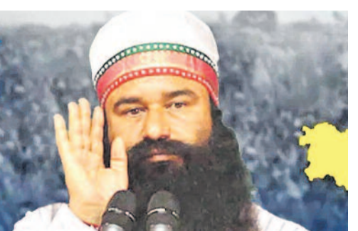
16 సార్లు పెరోల్ పై విడుదలై.. రోజులతరబడి బయటే తిరుగుతున్నారు. ఇప్పటికి గుర్జీత్ శిక్ష ప్రారంభమై 9 ఏళ్లు అవుతోంది. ఈ 9 ఏళ్ల కాలంలో ఆయన 400 రోజులకు పైగా జైలు బయటే గడిపారు. ప్రస్తుత పెరోల్ కాలంలో గుర్జీత్.. సిర్కల్ లోని డేరా సచ్చా సాదా ప్రధాన కేంద్రంలో ఉండనున్నారు. అధికారులు కఠిన నిఘా మధ్య ఆయనను అక్కడికి తరలించినట్లు సమాచారం. గతంలో ఎన్నికల సమయాల్లో కూడా రామ్ రహీమ్ కు పెరోల్ మంజూరు కావడం వివాదాస్పదమైంది. ప్రతిపక్ష పార్టీలు దీనిపై పలుమార్లు అభ్యంతరం వ్యక్తం చేశాయి. రామ్ రహీమ్ విడుదలయ్యే ప్రతిసారి ఆయన అనుచరులు పెద్ద ఎత్తున స్వాగతం పలుకుతున్నారు. భద్రతా కారణాల దృష్ట్యా ఈసారి కూడా హరియాణా పోలీసులు అప్రమత్తంగా ఉన్నారు.

న్యూఢిల్లీ, మే 26: అత్యాచార కేసులో 20 ఏళ్ల జైలు శిక్ష అనుభవిస్తున్న డేరా సచ్చా సాదా అధిపతి గుర్జీత్ రామ్ రహీమ్ అయిదో డేరా బాబా మరోసారి 30 రోజుల పెరోల్ పై విడుదలయ్యారు. హరియాణాలోని సునారియా జైలు నుంచి మంగళవారం బయటకు వచ్చారు. 2017లో శిక్ష పడిన తర్వాత ఆయనకు 16వసారి పెరోల్ లభించడం దేశవ్యాప్తంగా చర్చనీయాంశమైంది. తన శిష్యురాళ్లు ఇద్దరిపై అత్యాచారానికి ఒడిగట్టిన నేరానికి 20 ఏళ్ల జైలు శిక్ష అనుభవిస్తున్న డేరా సచ్చా సాదా అధిపతి గుర్జీత్ మరోసారి పెరోల్ పై విడుదలయ్యారు. 2017లో అతడికి శిక్ష పడిన నాటినుంచి పెరోల్ పై తాత్కాలికంగా విడుదలపడడం ఇది 16వ సారి. శిక్ష అనుభవిస్తున్న గత 9 ఏళ్లలో 400 రోజులకు పైగా అతడు జైలు బయటే గడిపాడు. ప్రస్తుత పెరోల్ కాలంలో డేరా బాబా సిర్కల్ లోని డేరా సచ్చా సాదా ప్రధాన కార్యాలయంలోనే ఉంటారని న్యాయవాది జితేందర్ ఖురానా తెలిపారు. 2002లో ఒక జర్నలిస్టు హత్య కేసులో ప్రత్యేక సీబీఐ కోర్టు డేరా బాబాకు యావజ్జీవ కారాగార శిక్ష విధించగా.. ఏడేళ్ల జైలు జీవితం తర్వాత నిర్దోషిగా విడుదలయ్యారు. ఆ తర్వాత, తన శిష్యురాళ్లపై లైంగిక వేధింపుల కేసులో 2017లో గుర్జీత్ కు 20 ఏళ్ల జైలు శిక్ష విధించారు. నాటినుంచి జైల్లోనే ఉంటున్నాడు. 2020 నుంచి ఇప్పటివరకు వివిధ కారణాలతో