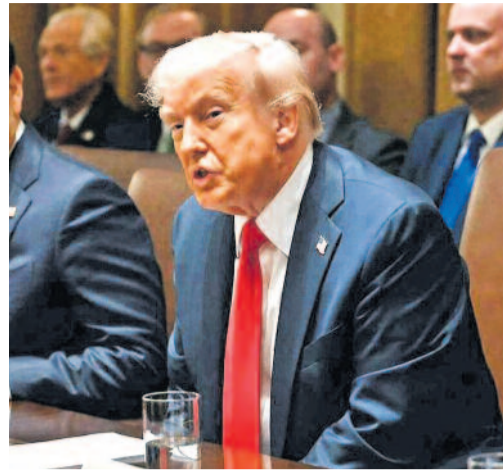
కాపాడేందుకు అవసరమైతే మరింత కఠిన నిర్ణయాలు తీసుకుంటామని కూడా చెప్పారు. కాగా, తమ వద్ద ఉన్న శుద్ధి చేసిన యురేనియంను వదులుకోవడానికి ఇరాన్ అంగీకరించినట్లు వార్తలు వస్తున్నాయి. తాము

న్యూఢిల్లీ, మే 26: అమెరికా-ఇరాన్ మధ్య జరుగుతున్న శాంతి చర్చల్లో అణు కార్యక్రమం కీలకంగా మారింది. శుద్ధ చేసిన యురేనియంను వదులుకోవాలని అమెరికా కోరుతుండగా, అందుకు ఇరాన్ పూర్తిగా అంగీకరించడం లేదు. తాజాగా ఇరాన్ అణు కార్యక్రమంపై అమెరికా అధ్యక్షుడు డొనాల్డ్ ట్రంప్ కీలక వ్యాఖ్యలు చేశారు. ఇరాన్ వద్ద ఉన్న అధికంగా శుద్ధి చేసిన యురేనియంను అమెరికాకు అప్పగించాలని, లేదంటే అంతర్జాతీయ పర్యవేక్షణలో పూర్తిగా ధ్వంసం చేయాలని ట్రంప్ స్పష్టం చేశారు. ఇరాన్ అణు కార్యక్రమం ప్రపంచ దేశాలకు ముప్పుగా మారే అవకాశమందని ట్రంప్ హెచ్చరించారు. అధిక శుద్ధి చేసిన యురేనియం ద్వారా అణ్వాయుధాల తయారీ సాధ్యమవుతుందని, అందుకే దీనిపై కఠిన చర్యలు అవసరమని పేర్కొన్నారు. అమెరికా జాతీయ భద్రతను