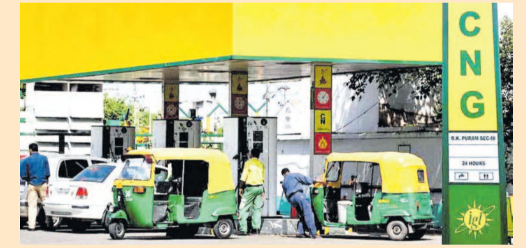
ఎన్నికలు ముగిసాక వరుసగా ధరలు పెంచుకుంటూ పోతున్నది. తాజాగా మరోసారి ఇంధన ధరలను పెంచింది. సోమవారం నాడు పెట్రోల్ పై లీటర్ కు రూ. 2.61, డీజిల్ పై లీటర్ కు రూ. 2.71 చొప్పున ధరలు పెరిగాయి. తాజా పెంపుతో మే 15 నుంచి

న్యూఢిల్లీ, మే 26: కేంద్రం మళ్లీ షాకిచ్చింది. సిఎన్జి ధరలను మరోసారి పెంచింది. కిలో సిఎన్జిపై రూ.2 పెంచింది. పెరిగిన ధరలు మంగళవారం నుంచే అమలులోకి వచ్చాయి. తాజా పెంపుతో ఢిల్లీలో సిఎన్జి ధర రూ.81.09 నుంచి రూ.83.09కి చేరింది. సిఎన్జి ధరలను పెంచడం మే 15వ తేదీ నుంచి ఇది నాలుగోసారి కావడం గమనార్హం. మే 15వ తేదీన మొదట కిలోకు రూ.2 పెంచగా.. అనంతరం రెండుసార్లు ఒక్క రూపాయి చొప్పున కేంద్రం పెంచింది. తాజాగా మరో రూ.2 పెరగడంతో నాలుగోసారి సిఎన్జి ధరలు పెరిగినట్లయ్యింది. గత 11 రోజుల్లో మొత్తం రూ.7 వరకు ధరలు పెరగడంతో వాహనదారులు, ఆటో, క్యాబ్, ట్రాన్స్పోర్ట్ రంగాలపై అదనపు భారం పడనుంది. ఎన్నికల ముందు ఇంధన ధరలు పెంచబోమని పదేపదే ప్రకటించిన కేంద్రం..