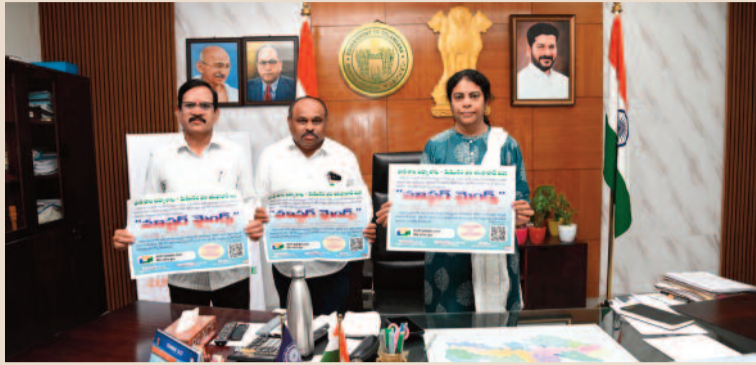
ఉద్యమ కెరటం, ఆసిఫాబాద్: