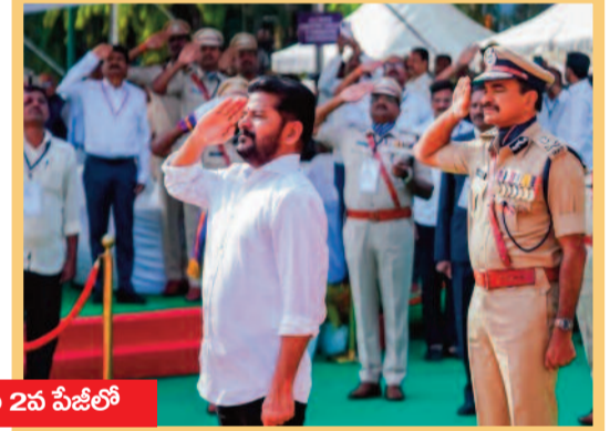
వివరాలు 2వ పేజీలో