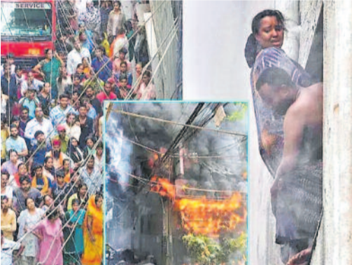
అగ్ని ప్రమాదం వల్ల అగ్నిమాపక దళాలు పనిచేస్తున్నాయి.

న్యూఢిల్లీ, జూన్ 3: దేశ రాజధాని ఢిల్లీలో ఘోర అగ్నిప్రమాదం చోటుచేసుకుని 21 మంది మృతి చెందారు. మా ఓల్వీయా నగర్ లోని హోటల్ రాణి ప్రాంతంలో ఉన్న ఫ్లోరిడ్ స్ట్రీ బ్రెడ్ బ్రేక్ ప్లాన్ హోటల్ లో మంటలు చెలరేగడంతో ఈ విషాదం సంభవించింది. ప్రమాదంలో పలువురు తీవ్రంగా గాయపడగా, వారి పరిస్థితి విషమంగా ఉండటంతో మృతుల సంఖ్య మరింత పెరిగే అవకాశం ఉందని అధికారులు తెలిపారు. ఉదయం 8.50 గంటల సమయంలో అగ్నిప్రమాదం జరిగినట్లు ఢిల్లీ అగ్నిమాపక శాఖకు సమాచారం అందింది. వెంటనే అగ్నిమాపక దళాలు, పోలీసులు, వివక్ష స్పందన బృందాలు ఘటనాస్థలికి చేరుకుని సహాయక చర్యలు చేపట్టాయి. అయితే అప్పటికే భవనమంతా దట్టమైన పొగతో నిండిపోవడంతో లోపల ఉన్నవారిని బయటకు తీసుకురావడం సవాలుగా మారింది. సహాయక బృందాలు 40 మందికి పైగా బాధితులను రక్షించి వివిధ ఆసుపత్రులకు తరలించాయి. మాక్స్ ఆసుపత్రికి తరలించిన 39 మందిలో 18 మంది మరణించినట్లు వైద్యులు నిర్ధారించారు. మరో 15 మందికి