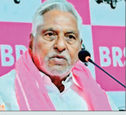
ఖరీఫ్ పంటకై నా రైతు భరోసా కల్పించాలని డిమాండ్