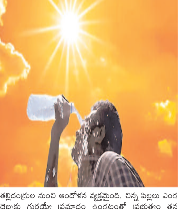
తల్లిదండ్రుల నుంచి అందోళన వ్యక్తమైంది. చిన్న పిల్లలు ఎండ దెబ్బకు గురయ్యే ప్రమాదం ఉండటంతో ప్రభుత్వం తన