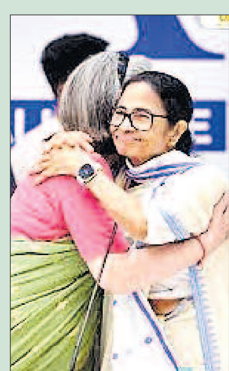
దుర్వినియోగానికి కాలం చెల్లే రోజులు ఈ మహా విలీనంతోనే మొదలవుతాయి

ప్రాంతీయ పార్టీలను విచ్ఛిన్నం చేసి వాళ్ల ఆస్తులను, పార్టీ గుర్తులను లాక్కోవాలని చూస్తున్న బీజేపీ వ్యూహాలకు ఈ విలీనం ద్వారా గట్టి చెక్ పెట్టవచ్చు. చీలిత వర్గాలకు ఎన్నికల సంఘం గుర్తింపు రాకుండా చేయాలంటే, పార్టీ ఉనికిని కాపాడుకోవాలంటే జాతీయ పార్టీ గొడుగు కిందకు రావడం అత్యంత అవశ్యకం. టీఎంసీ విలీనంతో కాంగ్రెస్ పార్టీకి బెంగాల్ లో తిరుగులేని బలం వస్తుంది. అలాగే జాతీయ స్థాయిలో బీజేపీకి ఎదురునిలబడే శక్తి రెట్టింపు అవుతుంది. మమత లాంటి పోరాటయోధురాలు కాంగ్రెస్ జాతీయ ఉపాధ్యక్షురాలిగా, యువ నేత అభిషేక్ బెనర్జీ ప్రధాన కార్యదర్శిగా బాధ్యతలు చేపడితే ప్రతిపక్ష కూటమికి కొత్త రక్తం వచ్చినట్లువుతుంది. ఇప్పటికే రాహుల్ గాంధీ దేశవ్యాప్తంగా సాగిస్తున్న సిద్ధాంతపరమైన పోరాటానికి.. మమతా బెనర్జీ మాన్ ఇమేజ్ తోడైతే బీజేపీని జాతీయ స్థాయిలో సమర్థవంతంగా ఢీకొట్టవచ్చు.