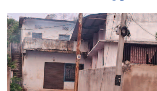
కనిపించేలా పెద్ద బోర్డు ఏర్పాటు చేయాలని పలువురు రైతులు కోరుతున్నారు. వ్యవసాయ శాఖ అధికారులు స్పందించి రైతుల సమస్యను పరిష్కరించాలని డిమాండ్ చేస్తున్నారు.

గుర్తింపు బోర్డు కూడా లేకపోవడంతో, ముఖ్యంగా ఇతర గ్రామాల నుంచి వచ్చే రైతులు కార్యాలయం కోసం వెతుక్కోవాల్సిన పరిస్థితి నెలకొంది. దీంతో వారి సమయం, శ్రమ వృథా అవుతున్నాయని రైతులు ఆవేదన వ్యక్తం చేస్తున్నారు. వృద్ధ రైతులు, నిరక్షరాస్యులు కార్యాలయం ఎక్కడుందో తెలియక స్థానికులను అడుగుతూ ఇబ్బందులు పడుతున్నారని తెలిపారు. బోర్డు లేకపోవడంతో అది ప్రభుత్వ కార్యాలయమో, అడ్డ భవనమో కూడా గుర్తించడం కష్టంగా మారిందని రైతులు పేర్కొన్నారు. "వ్యవసాయ కార్యాలయానికి గుర్తింపు బోర్డు లేకపోవడంతో అధికారులను కలవడానికి వచ్చిన రైతులు ఇబ్బందులు పడుతున్నారు. సంబంధిత అధికారులు స్పందించి, కార్యాలయం బయట స్పష్టంగా