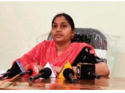
విజయవంతం చేయాలని కోరారు.

ఫోటో క్యాప్చరింగ్ చేయించుకోని పక్షంలో భవిష్యత్తులో పెన్షన్ పంపిణీలో ఇబ్బందులు ఎదురయ్యే అవకాశం ఉందని స్పష్టం చేశారు. పెన్నన్దారులు తమ పరిధిలోని వార్డు ఆఫీసర్లు, స్పెషల్ ఆఫీసర్లు, ఆర్డీ, మెప్పా అధికారులు, మున్సిపల్ కార్యాలయం, డిఆర్డీ కార్యాలయాలను సంప్రదించి వెంటనే ప్రక్రియ పూర్తి చేసుకోవాలని సూచించారు. అదేవిధంగా ప్రభుత్వం చేపట్టిన ఎన్ఐఆర్ ఫోటో ఓటర్ మ్యాపింగ్ కార్యక్రమంలో ప్రజలందరూ భాగస్వాములు కావాలని కోరారు. 2002 ఓటరు జాబితాలో ఉన్న కుటుంబ సభ్యుల ఓటరు వివరాలను ఇంటింటికి వచ్చే ఎన్యూమరేటర్లు, వార్డు ఆఫీసర్లు, బీఎల్ఓలకు అందించి ఓటర్ మ్యాపింగ్ ప్రక్రియను