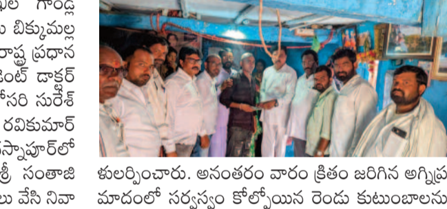
కులర్పించారు. అనంతరం వారం క్రితం జరిగిన అగ్నిప్రమాదంలో సర్వస్వం కోల్పోయిన రెండు కుటుంబాలను