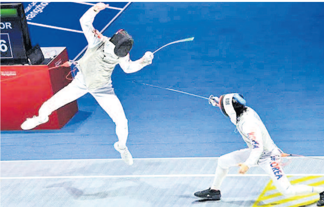
సీనియర్ స్టాయి ఆసియా ఫెన్సింగ్ ఛాంపియన్షిప్ నిర్వహించడం భారత క్రీడా చరిత్రలో ఒక ముఖ్యమైన మైలురాయి. ప్రపంచ స్టాయి ఫెన్సర్లను ఆహ్వానించడంతో పాటు 2028 ఒలింపిక్స్ సన్నాహకాలకు ఇది మంచి వేదికగా నిలుస్తుంది. ఈసారి ఆర్టిఫిషియల్ ఇంటెలిజెన్స్ ఆధారిత వీడియో రిఫరల్ వ్యవస్థను కూడా వినియోగిస్తున్నారు