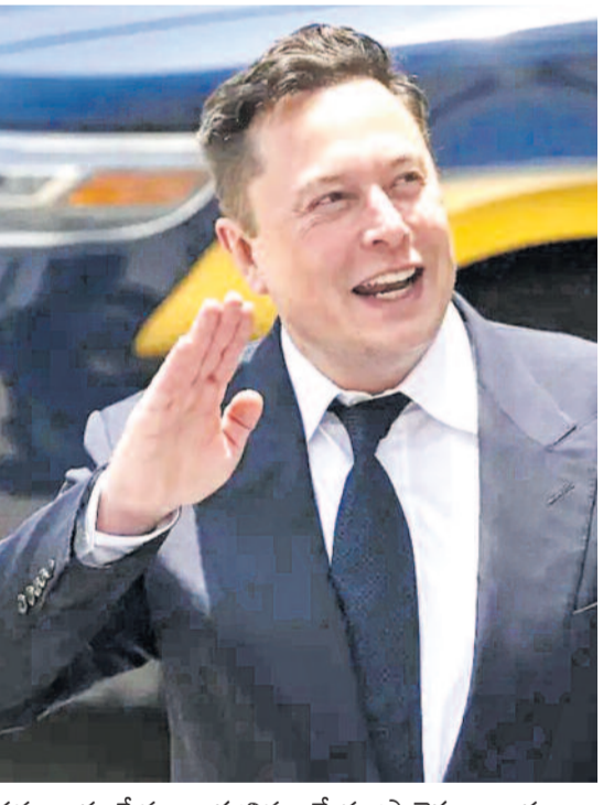
సమాచార సేవలు, కృత్రిమ మేధ ప్రాజెక్టుల కారణంగా

న్యూయార్క్, జూన్ 17: ప్రపంచంలోని అత్యంత ధనవంతుల జాబితాలో ఎప్పుడూ అగ్రస్థానంలో ఉండే ప్రముఖ పారిశ్రామికవేత్త ఎలన్ మస్క్ మరోసారి అంతర్జాతీయ వ్యాపార వర్గాల్లో చర్చనీయాంశంగా మారారు. అంతరిక్ష పరిశోధన, విద్యుత్ వాహనాలు, కృత్రిమ మేధ రంగాల్లో విస్తృత పెట్టుబడులు పెట్టిన ఆయన సంపద కొత్త గరిష్ట స్థాయికి చేరుకున్నట్లు మార్కెట్ వర్గాలు పేర్కొంటున్నాయి. దీంతో మానవ చరిత్రలోనే తొలి ట్రిలియన్ డాలర్ల వ్యక్తిగా అన్ని కలిగిన వ్యక్తిగా ఆయన నిలిచారనే ప్రచారం ప్రపంచవ్యాప్తంగా దృష్టిని ఆకర్షిస్తోంది. ఇటీవల ఎలన్ మస్క్ కు చెందిన అంతరిక్ష సాంకేతిక సంస్థ స్పేస్ఎక్స్ అమెరికా స్టాక్ మార్కెట్లో ప్రవేశించిన తర్వాత పెట్టుబడిదారుల నుంచి భారీ స్పందన లభించినట్లు ఆర్థిక విశ్లేషకులు చెబుతున్నారు. మార్కెట్లో నమోదైన షేర్లకు భారీ డిమాండ్ ఏర్పడటంతో కంపెనీ విలువ గణనీయంగా పెరిగింది. అంతరిక్ష ప్రయోగాలు, ఉపగ్రహ ఆధారిత