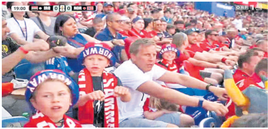
మసాచుసెట్స్, జూన్ 17 : ప్రపంచకప్ ఫుట్ బాల్ టోర్నీ గ్రూప్-బ లీగ్ మ్యాచ్లో నార్వే జట్టు ఘన విజయంతో శుభారంభం చేసింది. జిబ్రల్టర్ స్టేడియంలో జరిగిన మ్యాచ్లో ఇరాక్పై 4-1 గోల్స్ తేడాతో విజయం సాధించింది. దాదాపు 28 ఏళ్ల తర్వాత ప్రపంచకప్ వేదికపై అడుగుపెట్టిన నార్వే జట్టుకు అభిమానులు భారీ మద్దతు తెలిపారు. స్టేడియం నిండా నార్వే అభిమానులు తమ సంప్రదాయ 'వైకింగ్ రో' ప్రదర్శనతో

39వ నిమిషంలో ఐమెన్ హుస్సేన్ శక్తివంతమైన హెడర్ ద్వారా గోల్ చేసి స్కోరును 1-1తో సమం చేశాడు. దీంతో తొలి అర్ధభాగం ఉత్పండనంతో సాగింది. అయితే రెండో అర్ధభాగంలో నార్వే పూర్తి ఆధిపత్యం చెలాయించింది. 76వ నిమిషంలో లియో ఓస్టిగార్ మరో గోల్ నమోదు చేయగా, మ్యాచ్ ముగింపు దశలో ఇరాక్ ఆటగాడు చేసిన స్వీయ గోల్తో నార్వే ఖాతాలో నాలుగు గోల్స్ చేరింది. దీంతో నార్వే 4-1 తేడాతో ఘన విజయం సాధించి గ్రూప్-బలో క్రీకెట్ రెండు పాయింట్లు సొంతం చేసుకుంది. ఈ మ్యాచ్లో హాలాండ్ అద్భుత ప్రదర్శనతో పాటు నార్వే అభిమానుల 'వైకింగ్ రో' ప్రత్యేక ఆకర్షణగా నిలిచింది. వేలాది మంది అభిమానులు ఒకే తీరులో చేతులు పైకెత్తి చప్పట్లు కొడుతూ గర్జనలు చేయడంతో స్టేడియం మొత్తం మారుమోగిపోయింది. ప్రస్తుతం ఈ దృశ్యాలు సామాజిక మాధ్యమాల్లో విస్తృతంగా వైరల్ అవుతున్నాయి. 'వైకింగ్ రో' అనేది నార్వే, ఐస్లాండ్ వంటి ఉత్తర యూరప్ దేశాల ఫుట్ బాల్ అభిమానుల ప్రత్యేక సంప్రదాయం. అభిమానులు ఏకకాలంలో చేతులు పైకెత్తి చప్పట్లు కొడుతూ గట్టిగా గర్జనలు చేయడం ద్వారా ఆటగాళ్లలో యుద్ధస్ఫూర్తిని నింపుతారు. ఈ విన్యాసం ప్రపంచ ఫుట్ బాల్ అభిమానులను ఎప్పటికప్పుడు ఆకట్టుకుంటూ ఉంటుంది.