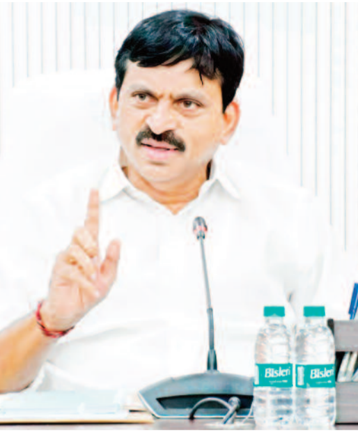
రెండో విడతలో 2.50 లక్షల ఇళ్లు..

రెండో విడత కింద రాష్ట్రవ్యాప్తంగా 2.50 లక్షల ఇళ్లు