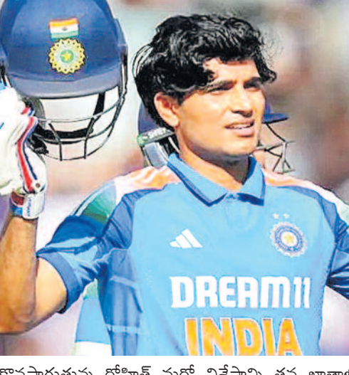
కొనసాగుతున్న రోహిత్ మరో విశేషాన్ని తన ఖాతాలో

లక్నో, జూన్ 17 : భారత జట్టు కెప్టెన్ శుభ్ మన్ గిల్ వనే క్రికెట్లో మరో అరుదైన ఘనతను తన ఖాతాలో చేసుకున్నాడు. న్యూజీలాండ్ అత్యంత వేగంగా 1,000 వనే పరుగులు పూర్తి చేసిన భారత బ్యాటర్ గా నిలిచి విరాట్ కోహ్లా పేరిట ఉన్న రికార్డును అధిగమించాడు. ఆస్ట్రేలియాతో లక్నో వేదికగా జరుగుతున్న రెండో వన్డే మ్యాచ్లో ఈ మైలురాయిని అందుకున్నాడు. అద్భుతమైన ఫామ్లో కొనసాగుతున్న గిల్ ఈ మ్యాచ్లో మరోసారి భార్యతాయుతమైన ఇన్స్వింగ్ ఆడి అర్ధశతకం నమోదు చేశాడు. తన క్లౌస్ బ్యాటింగ్ తో భారత జట్టుకు శుభారంభం అందించడంతో పాటు కీలక రికార్డును సొంతం చేసుకున్నాడు. మరోవైపు భారత జట్టు సీనియర్ బ్యాటర్ రోహిత్ శర్మ కూడా అరుదైన ఘనత సాధించాడు. లిస్ట్-ఏ క్రికెట్లో 14,000 పరుగుల మార్కును అందుకున్న ఆటగాడిగా రికార్డు ఘనకాల్లో చోటు దక్కించుకున్నాడు. భారత్ క్రికెట్లో అత్యంత నిలకడైన బ్యాటర్లలో ఒకరిగా