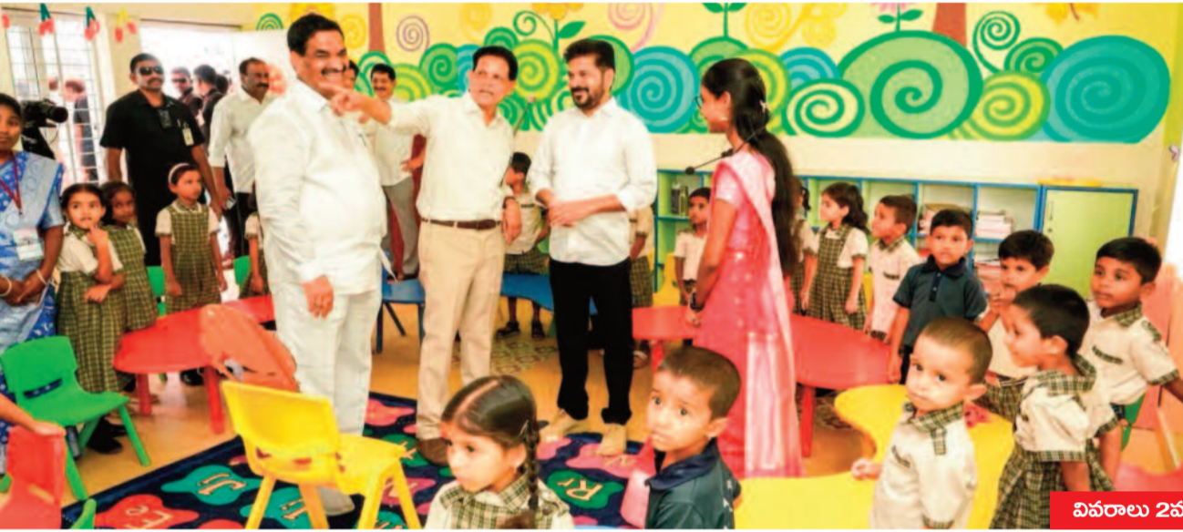
వివరాలు 2వ పేజీలో