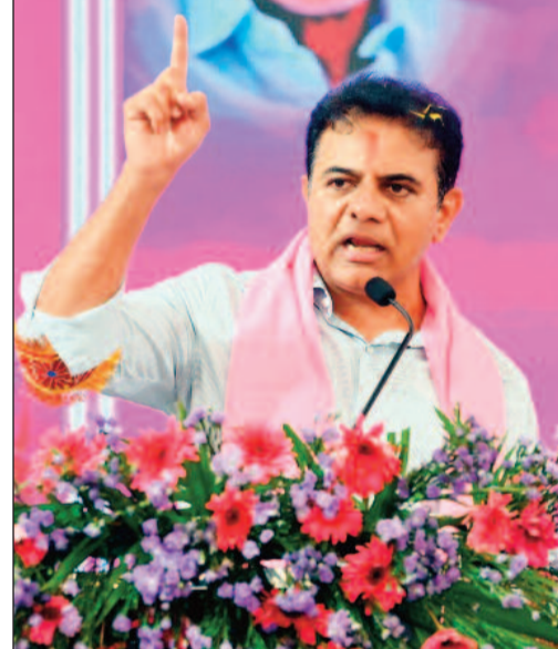
అనవ్వస్తం చేశారని ఆరోపించారు. కేటీఆర్ ప్రాణాలకు

ఖమ్మం: రాష్ట్రంలో ఎక్కడ చూసినా కూల్చివేతలే కనిపిస్తున్నాయని, సంక్షేమం లేదని అంతా సంక్షోభమేనని బీఆర్ఎస్ వర్కింగ్ ప్రెసిడెంట్ కేటీఆర్ విమర్శించారు. కాంగ్రెస్ నేతలు దండుపాళ్ళం బ్యాచ్ లా రాష్ట్రాన్ని దోచుకుంటున్నారని, ముఖ్యమంత్రి రేవంత్ రెడ్డికి మంత్రులు సైతం తీసిపోవడం లేదని ఆయన మండిపడ్డారు. రాష్ట్రంలో ఎన్నికలు ఎప్పుడొచ్చినా మళ్లీ బీఆర్ఎస్ దే అధికారమని, కేటీఆర్ తిరిగి సీఎం కావడం ఖాయమని ధీమా వ్యక్తం చేశారు. ఖమ్మం జిల్లా పాలేరు నియోజకవర్గంలో నిర్వహించిన టాక్ టెబల్ కార్యక్రమ శిక్షణ కార్యక్రమంలో ఆయన మాట్లాడారు. రాష్ట్రంలో రేవంత్ రెడ్డి రాక్షస పాలన సాగిస్తున్నారని, దండుపాళ్ళం ముఠాకు ఆయన అధ్యక్షుడైతే.. మంత్రులు ఆయన్ను మించిపోయారని కేటీఆర్ తీవ్రస్థాయిలో ధ్వజమెత్తారు. రెవెన్యూ మంత్రి అవినీతికి హద్దులు లేకుండా పోయిందని, ఖమ్మం జిల్లాకు చెందిన ముగ్గురు మంత్రులు దాచుకోవడం, దోచుకోవడం తప్ప జిల్లాకు చేసినదేమీ లేదని విమర్శించారు. ఒక మంత్రి భూ కబ్జాలకు పాల్పడుతుంటే, మరో మంత్రి వ్యవసాయ రంగాన్ని తీవ్ర సంక్షోభంలోకి నెట్టారని, ఆర్థిక మంత్రి రాష్ట్ర పరిస్థితిని