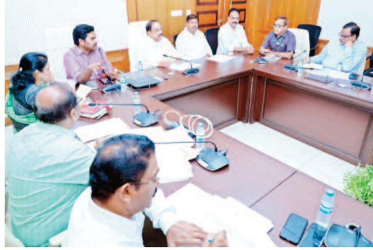
యూరియా యాప్ అదుర్స్..

ఖరీఫ్ సీజన్ లో ఎరువుల సరఫరాపై ఫెర్టిలైజర్ డీలర్లతో మంత్రి చర్చించారు. ఎరువుల సరఫరాలో రైతులకు ఎలాంటి ఇబ్బందులు కలగకుండా చూడాలని బాధ్యత అందరిపైనా ఉండవలసిందిగా ఆయన కోరారు. సాగు విస్తీర్ణం ఆధారంగా యూరియా పంపిణీ చేసేలా రాష్ట్ర ప్రభుత్వం యాప్ రూపొందించినది, ఈ విధానాన్ని కేంద్రంతో పాటు ఇతర రాష్ట్రాలకు కూడా ప్రయోగాత్మకంగా అమలు చేసేందుకు సన్నాహాలు చేస్తున్నాయని తెలిపారు. సాంకేతికతను వినియోగించి సరైన రైతుకు, సరైన పరిమాణంలో యూరియా అందించడమే తమ లక్ష్యమన్నారు. యాప్ రాకతో రద్దీ సమస్య తగ్గిందని, రైతులు తమకు అనుకూలమైన సమయంలో వచ్చి ఎరువులు కొనుగోలు చేస్తున్నారని డీలర్ల మంత్రి దృష్టికి తెచ్చారు.