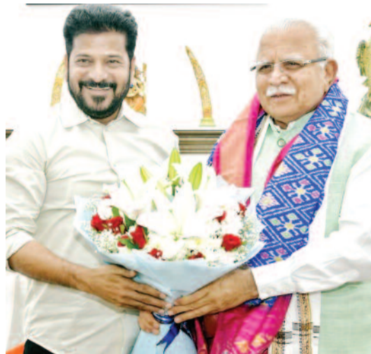
కన్సల్టెంట్ ఎంపిక.. రోడ్ మ్యాప్..