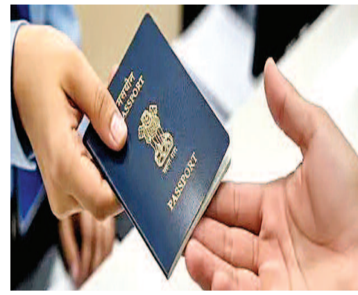
14 ఏళ్ల తర్వాత మరోసారి ఫీజులను పెంచడం గమనార్హం.

పాస్ పోర్టు పోగొట్టుకున్న వారు కొత్తగా 36 పేజీల పాస్ పోర్టు పొందాలంటే ఇకపై రూ. 5,000 చెల్లించాల్సి ఉంటుంది. తర్వాత విధానంలో ఈ ఫీజు రూ. 7,500గా నిర్ణయించారు. 60 పేజీల పాస్ పోర్టు విషయంలో సాధారణ ఫీజు రూ. 6,000 కాగా, తర్వాత ద్వారా దరఖాస్తు చేసుకుంటే రూ. 8,500 చెల్లించాల్సి ఉంటుంది. పాస్ పోర్టు నిబంధనల్లో మార్పులు చేస్తూ విదేశాంగ శాఖ కొత్త ఫీజులను ప్రకటించింది. చివరిసారిగా 2012లో పాస్ పోర్టు రుసుములను సవరించగా, ఇప్పుడు