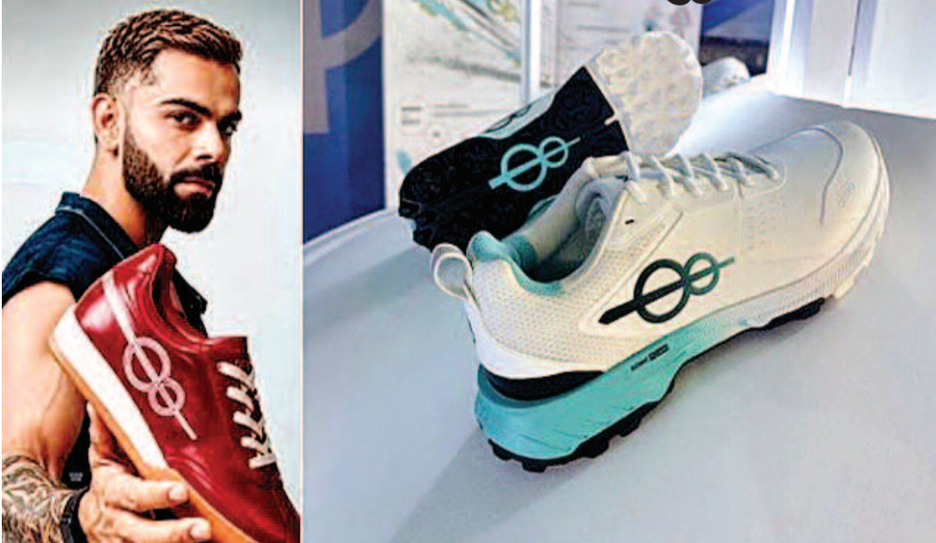
లభించడం గమనార్హం. ఈ విజయంతో కోహ్లా కేవలం ఐకాన్ గా తన స్థానాన్ని మరింత బలపర్చుకున్నారని క్రికెటర్ గా మాత్రమే కాకుండా, గ్లోబల్ స్పోర్ట్స్ బ్రాండ్ మార్కెట్ విశ్లేషకులు పేర్కొంటున్నారు.

ముంబై, జూన్ 25 : టీమిండియా స్టార్ క్రికెటర్ విరాట్ కోహ్లా మరోసారి తన బ్రాండ్ విలువతో వార్తల్లో నిలిచారు. ఆయన ప్రారంభించిన 'వన్8' గ్లోబల్ షూ బ్రాండ్ లాంచ్ అయిన కేవలం 24 గంటల్లోనే లక్షన్నర జతలు అమ్ముడై సరికొత్త రికార్డు సృష్టించాయి. ఈ అమ్మకాలతో ఒక్కరోజులోనే రూ.138 కోట్లకు పైగా ఆదాయం వచ్చినట్లు మార్కెట్ వర్గాలు అంచనా వేస్తున్నాయి. క్రీడారంగాలో మాత్రమే కాకుండా వ్యాపార ప్రపంచంలోనూ కోహ్లాకి ఉన్న క్రేజ్ ఈ ఫలితాలతో స్పష్టమవుతోందని నిపుణులు చెబుతున్నారు. ఈ షూస్ ధరను కోహ్లా టెస్ట్ క్రికెట్లో సాధించిన 9,230 పరుగులకు గుర్తుగా రూ.9,230గా నిర్ణయించడం ప్రత్యేక ఆకర్షణగా మారింది. ప్రీ-బుక్ ఆధారంగా మాత్రమే అమ్మకాలు జరగడంతో అభిమానుల్లో భారీ ఆసక్తి నెలకొంది. లాంచ్ ఈవెంట్లో పాల్గొనడానికి కూడా ప్రత్యేకంగా ప్రీ-బుక్ చేసిన కొనుగోలుదారులకే అవకాశం కల్పించారు. అయినప్పటికీ అభిమానుల నుంచి ఊహించని స్పందన