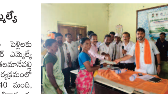
ఆడపిల్లల వివాహాల కోసం కళ్యాణలక్ష్మి, షాదీ ముబారక్ పథకాల ద్వారా ఆర్థిక సహాయం అందిస్తోందని