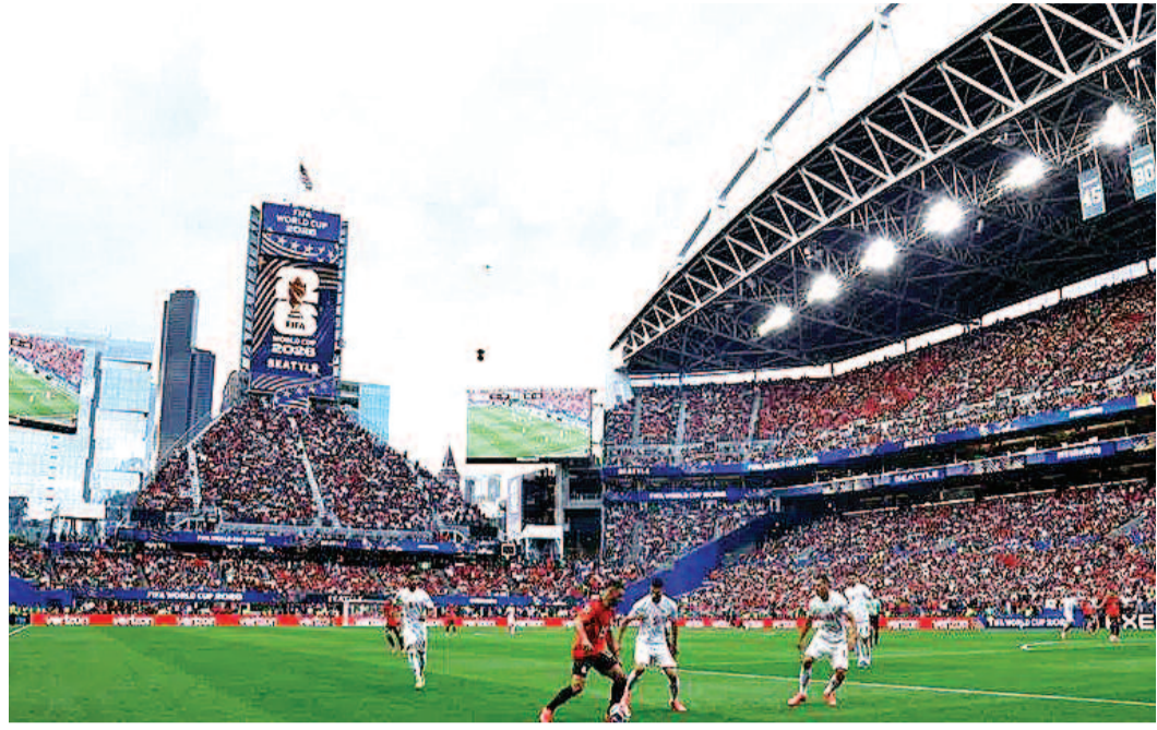
పెట్రూ. అలాగే క్రోయేషియా, రొమేనియా, పోలాండ్, కొలంబియా దేశాల్లో కూడా అక్రమ ప్రసారాలకు సంబంధించి పనిచేస్తున్న హ్యాకింగ్ కేంద్రాలను గుర్తించినట్లు అమెరికా

న్యూయార్క్, జూన్ 27 : ఫిఫా ప్రపంచ కప్ మ్యాచ్ లను అక్రమంగా ప్రత్యక్ష ప్రసారం చేస్తున్న సుమారు 400 వెబ్ సైట్లను అమెరికా అధికారులు స్వాధీనం చేసుకున్నారు. కాపీరైట్ చట్టాలను ఉల్లంఘిస్తూ మ్యాచ్ లను అనుమతి లేకుండా ప్రసారం చేస్తున్న ఈ డొమెయిన్లను గుర్తించి చర్యలు తీసుకున్నట్లు అమెరికా న్యాయ శాఖ వెల్లడించింది. ఫిఫా సంస్థతో పాటు పలు దర్భాప్తు సంస్థలు, అంతర్జాతీయ భాగస్వామ్య సంస్థల సహకారంతో ఈ అక్రమ వెబ్ సైట్లను గుర్తించినట్లు అధికారులు తెలిపారు. ప్రముఖ ప్రసార సంస్థలు ఎన్టీవీ యూనివర్సల్, వార్నర్ బ్రదర్స్ కూడా ఈ దర్భాప్తులో సహకరించినట్లు వెల్లడించారు. అక్రమ ప్రత్యక్ష ప్రసారాల ద్వారా అధికారిక ప్రసార హక్కులు కలిగిన సంస్థలకు భారీ ఆర్థిక నష్టం కలిగించడమే ఈ వెబ్ సైట్ల ప్రధాన ఉద్దేశమని అమెరికా న్యాయ శాఖ పేర్కొంది. ఈ వెబ్ సైట్లు కాపీరైట్ చట్టాలను స్పష్టంగా ఉల్లంఘించినట్లు కోర్టు నిర్ధారించిన నేపథ్యంలో వాటిపై చర్యలు తీసుకున్నట్లు తెలిపింది. అంతర్జాతీయ కంప్యూటర్ హ్యాకింగ్, మేధోసంవత్తి పరిరక్షణ విభాగంలో శిక్షణ పొందిన అధికారులు పలు దేశాల్లో దర్భాప్తు చేపట్టి అక్రమ ప్రసార సర్దుబాటు, డొమెయిన్లను గుర్తించారు. ముఖ్యంగా పెరూ, ఇథియోపియాలో ఈ సర్దుబాటు నిర్వహిస్తున్నట్లు గుర్తించిన అధికారులు అక్కడి కేంద్రాలపై ప్రత్యేక నిఘా