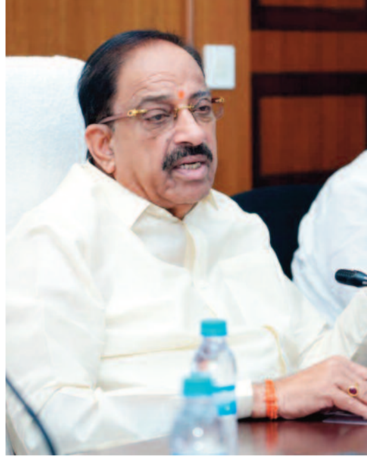
సుందరంగా తీర్చిదిద్దాలని సూచించారు. కొన్ని ప్రాంతాల్లో

అతి భారీ వర్షాలు కురిసే అవకాశం ఉన్నందున అత్యంత అప్రమత్తంగా ఉండాలన్నారు.