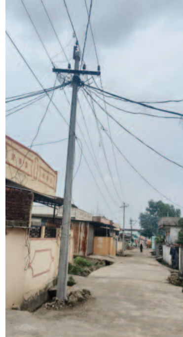
బాలాజీ నగర్ లో లో వోల్టేజీ సమస్య ఎంత తీవ్రంగా ఉందంటే.. ఇళ్లలో కనీసం ఫ్యాన్లు తిరగవు, బల్బులు వెలగవు. తక్కువ వోల్టేజీ కారణంగా ఇళ్లలోని