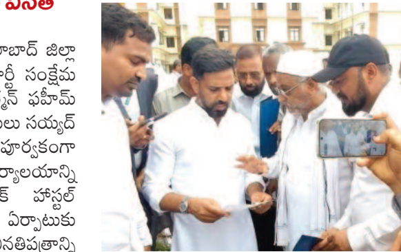
ఉన్నత విద్యా అవసరాలను తీర్చేందుకు గర్ల్స్ డిగ్రీ కాలేజీని ప్రారంభించడం ఎంతో ప్రయోజనకరంగా