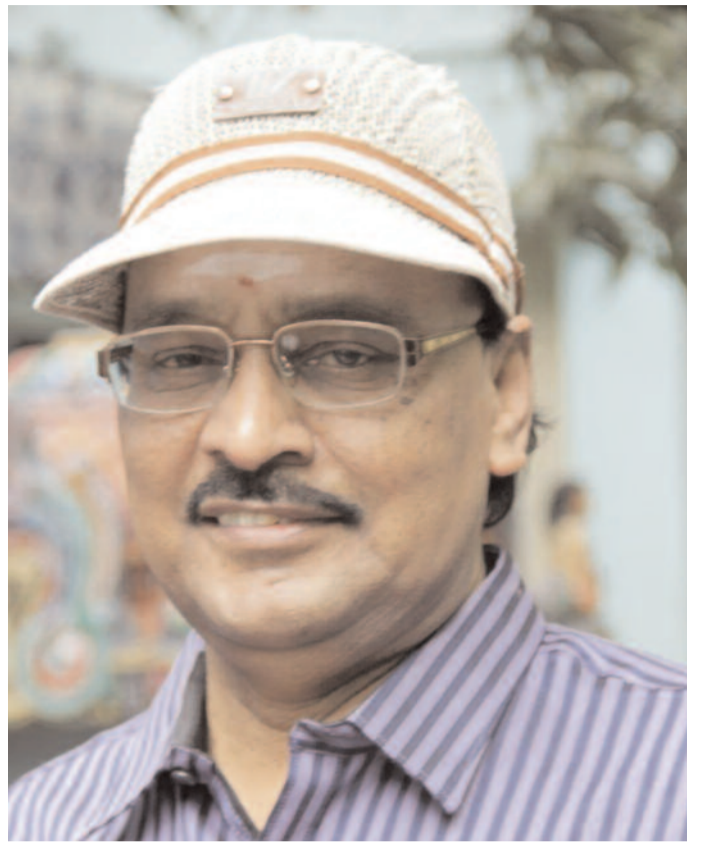
ప్రదర్శించి దక్షిణ భారత సినీ పరిశ్రమలో ప్రత్యేక స్థానం సంపాదించారు. భాగ్యరాజును ఇండియన్ సినీమాలో 'కింగ్ ఆఫ్ స్క్రీన్ ప్లే' అని పిలుస్తుంటారు.