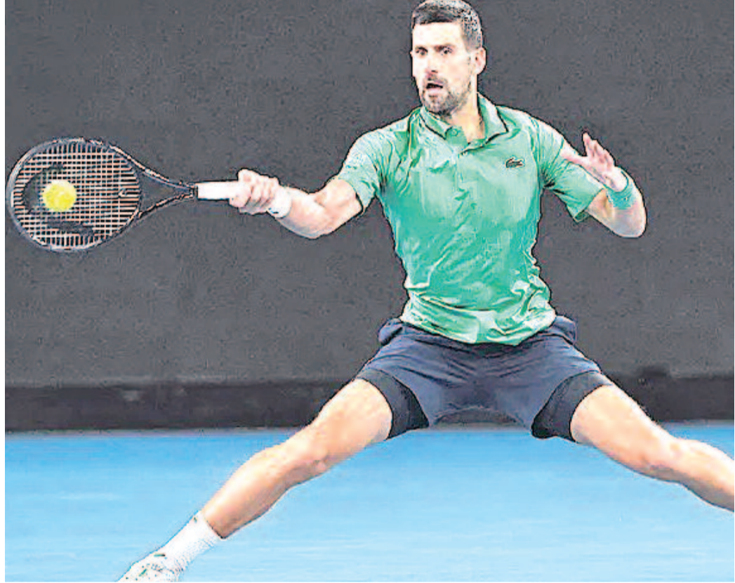
నులోనే వృత్తిపరమైన టెన్నిస్ లో అడుగుపెట్టిన జొకోవిచ్ తన కెరీర్ లో రికార్డు స్థాయిలో 24 గ్రాండ్ స్లామ్ సింగిల్స్ టైటిళ్లు గెలుచుకున్నారు. ఒలింపిక్ స్వర్ణ పతకం, ప్రపంచ నంబర్-1 స్థానంలో అత్యధిక వారాలు కొనసాగిన ఘనత, ఎనిమిది సార్లు ఏడాది ముగింపు నంబర్-1

లండన్, జూన్ 27 : ప్రపంచ టెన్నిస్ లో ఎన్నో రికార్డులు సృష్టించిన స్టార్ క్రీడాకారుడు నోవాక్ జొకోవిచ్ ఇప్పుడు వ్యాపార రంగంలోనూ కీలక బాధ్యతలు చేపట్టారు. ప్రముఖ అంతర్జాతీయ ప్రైవేట్ పెట్టుబడి సంస్థ జనరల్ అట్లాంటిక్ కు ప్రపంచ వ్యాపారాత్మక సలహాదారుగా ఆయనను నియమించినట్లు సంస్థ అధికారికంగా ప్రకటించింది. రికార్డు స్థాయిలో 25వ గ్రాండ్ స్లామ్ టైటిల్ లక్ష్యంగా వింబుల్డన్ టోర్నీలో బరిలోకి దిగేందుకు సిద్ధమవుతున్న సమయంలో ఈ ప్రకటన ప్రాధాన్యం సంతరించుకుంది. కొత్త బాధ్యతల్లో భాగంగా జొకోవిచ్ సంస్థ ఉన్నతాధికారులు, అనుబంధ సంస్థలు, పెట్టుబడిదారులతో కలిసి పనిచేయనున్నారు. నాయకత్వ లక్షణాలు, క్రమశిక్షణ, మానసిక దృఢత్వం, సరికొత్త ఆలోచనలపై తన అనుభవాలను పంచుకుంటున్నారు. ముఖ్యంగా ఆరోగ్యం, శ్రేయస్సు రంగాల్లో సంస్థ కార్యకలాపాలను మరింత విస్తరించేందుకు జొకోవిచ్ అనుభవం, ప్రపంచవ్యాప్త పరిచయాలు ఉపయోగపడతాయని సంస్థ భావిస్తోంది. ఇటీవలి కాలంలో జొకోవిచ్ వ్యాపార రంగంలో కూడా తన పెట్టుబడులను విస్తరిస్తున్నారు. ఆరోగ్య ఉత్పత్తులు, పోషకాహార పదార్థాలు, ఆహార ఉత్పత్తులు, ధరించగలిగే సాంకేతిక పరికరాల రంగాల్లో పలు సంస్థలకు పెట్టుబడులు పెట్టడంతో పాటు కొత్త సంస్థలను కూడా ప్రారంభించారు. ఈ నియామకంపై స్పందించిన జొకోవిచ్, క్రీడల్లో విజయం సాధించేందుకు అవసరమైన క్రమశిక్షణ, దీర్ఘకాలిక ఆలోచన, నిరంతరం మెరుగుపడాలనే తపనే వ్యాపార విజయానికి కూడా మూలమని పేర్కొన్నారు. అలాంటి విలువలతో ముందుకు సాగుతున్న ఈ సంస్థలో భాగస్వామ్యం కావడం తనకు ఎంతో ఆనందంగా ఉందని తెలిపారు. పదిహేనేళ్ల వయ-