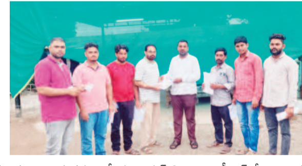
కార్యక్రమంలో మున్సిపల్ సిబ్బంది, బీఎల్ఓలు, వార్డు ప్రముఖులు మరియు స్థానిక ప్రజలు పెద్ద సంఖ్యలో పాల్గొన్నారు.