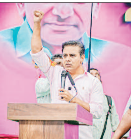
అసెంబ్లీ ఎన్నికల యుద్ధానికి ఇప్పటి నుంచే పార్టీ శ్రేణులు సిద్ధం కావాలని ఆయన పిలుపునిచ్చారు.