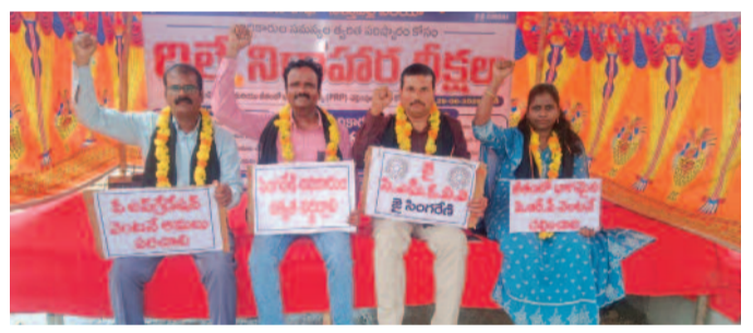
డిమాండ్లను తక్షణమే పరిష్కరించాలని కోరారు. అధికారుల ప్రధాన డిమాండ్లలో పనితీరు ఆధారిత ప్రోత్సాహక వేతనం (పీఆర్టీ) బకాయిలను వెంటనే విడుదల చేయడం, పెండింగ్లో ఉన్న వేతనాల ఉన్నతీకరణను అమలు చేయడం ప్రధానమైనవని తెలిపారు. ఈ

ఉద్యమ కెరటం, సత్తుపల్లి: సింగరేణి అధికారుల న్యాయమైన సమస్యలను వెంటనే పరిష్కరించాలని డిమాండ్ చేస్తూ భారత బొగ్గు గనుల అధికారుల సంఘం (సీఎంఓఐ) సింగరేణి శాఖ అధ్యక్షులతో చేపట్టిన రిలే నిరాహార దీక్షలు గురువారం సత్తుపల్లి సింగరేణి ప్రాంతంలో నాలుగో రోజుకు చేరుకున్నాయి. దీక్షా శిబిరంలో పాల్గొన్న అధికారులకు తోటి అధికారులు, ఉద్యోగులు, సిబ్బంది పెద్ద ఎత్తున సంఘీభావం ప్రకటించారు. ఈ సందర్భంగా సంఘ ప్రతినిధులు మాట్లాడుతూ సింగరేణి సంస్థ అభివృద్ధికి రాత్రింబవళ్లు కృషి చేస్తున్న అధికారుల పట్ల యాజమాన్యం, ప్రభుత్వం నిర్లక్ష్యవైఖరిని వీడి న్యాయమైన