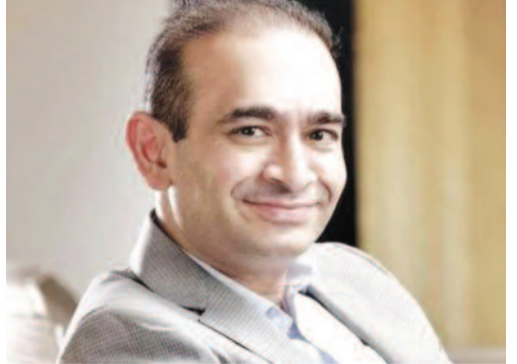
పునఃసమీక్షించాలన్న నీరవ్ మోదీ అభ్యర్థనను కొట్టివేసింది.

చేసింది. అయితే, నీరవ్ మోదీ తన అప్పగించే సుగమం అడ్డుకోవడానికి, అలస్యం చేయడానికి యాకే న్యాయవ్యవస్థలో అందుబాటులో ఉన్న అన్ని లీగల్ ఆప్షన్లను ఉపయోగించుకున్నారు. బ్రిటన్ దేశీయ కోర్టుల్లో అన్ని ప్రయత్నాలూ విఫలం కావడంతో, ఆఖరి ప్రయత్నంగా 2026 ఏప్రిల్లో ఆయన యూరోపియన్ కోర్ట్ ఆఫ్ హ్యూమన్ రైట్స్ ను ఆశ్రయించారు. భారత్ ఇచ్చిన జైలు భద్రతా హామీలపై కోర్టు సంతృప్తి.. భారత్కు అప్పగిస్తే అక్కడి జైళ్లలో తనకు ప్రాణపోని లేదా అమానవీయ ప్రవర్తన ఎదురవుతుందంటూ నీరవ్ మోదీ తరపు న్యాయవాదులు వాదించారు. అయితే, ముంబైలోని ఆర్టర్ రోడ్ జైలు భద్రత, ఖైదీల వల్ల వ్యవహారంపై తీర్పు భారత ప్రభుత్వం ఇచ్చిన దౌత్యపరమైన హామీలు అత్యంత సంతుష్టికరంగానే ఉన్నాయని ఇప్పటికే యాకే హైకోర్టు స్పష్టం చేసింది. డిఫెన్స్ ట్రోకర్ సంజయ్ భండారీ కేసులో మానవతా దృక్పథంతో అప్పగించే నిరాకరించిన తీర్పును నీరవ్ మోదీ ఇక్కడ ఉదహరించినప్పటికీ.. బ్రిటన్ కోర్టు ఆ వాదనను తీసుకున్నట్లుంది. 2026 మార్చిలో లండన్ హైకోర్టు (కింగ్ బెన్ డివిజన్) కూడా ఈ కేసును తిరిగి