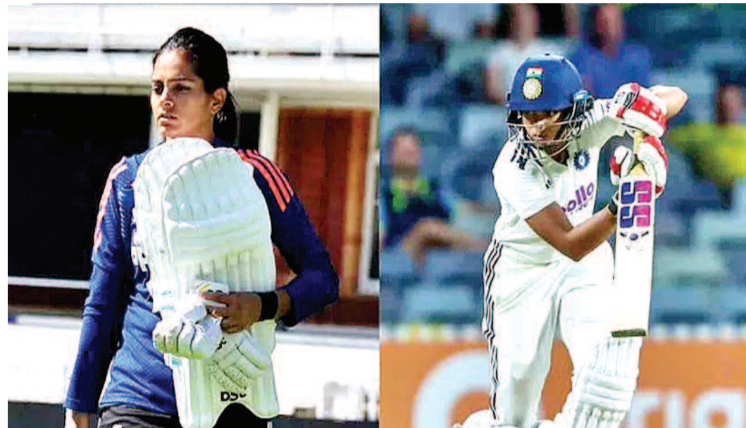
ముంబై, జులై 9: మహిళల టీ20 ప్రపంచకప్లో నిరాశపడిన భారత్ జట్టు ఇప్పుడు లార్డ్స్లో చారిత్రాత్మక టెస్టుకు సిద్ధమైంది. శుక్రవారం ఇంగ్లండ్తో జరిగే ఏకైక టెస్టులో విజయమే లక్ష్యంగా బరిలోకి దిగుతుంది. అయితే మ్యాచ్కు ముందే భారత్ జట్టుకు గట్టి ఎదురుదెబ్బ తగిలింది. మిడిల్ ఆర్డర్ బ్యాటర్ ప్రతీకా రావల్ గాయం కారణంగా ఈ మ్యాచ్కు దూరమైంది. గత వారం ఇండియా-ఏ, ఇంగ్లండ్-ఏ జట్టు మధ్య జరిగిన మ్యాచ్లో ఫీల్డింగ్ చేస్తూ ప్రతీకా రావల్ మోకాలికి గాయమైంది. గాయం తీవ్రత కారణంగా ఆమె ఇంకా పూర్తిగా

కోలుకోకపోవడంతో లార్డ్స్ టెస్టులో ఆడే అవకాశం కోల్పోయింది. ప్రధాన కోచ్ అమోల్ మజుందార్ మాట్లాడుతూ.. ప్రతీకా మోకాలికి గాయం కావడంతో కుట్టు పడ్డాయని, అందుకే ఆమెను జట్టు నుంచి తప్పించాలి వచ్చిందని తెలిపారు. ఆమె స్థానంలో అనుభవజ్ఞురాలైన ప్రియా పూనియాను జట్టులోకి తీసుకున్నట్లు వెల్లడించారు. అయితే ప్రతీకా రావల్ స్థానంలో మూడో స్థానంలో ఎవరూ బ్యాటింగ్కు దిగుతారనేది ఆసక్తికరంగా మారింది. ఈ స్థానానికి యస్వికా భాటియా, హర్షిత్ డియోల్ మధ్య పోటీ నెలకొంది. జట్టు సమతుల్యంగా ఉండటాని తుది నిర్ణయం తీసుకున్నట్లు తెలుస్తోంది. 150 ఏళ్ల చరిత్ర కలిగిన లార్డ్స్ మైదానంలో జరుగుతున్న తొలి మహిళల టెస్టులో ఆడే అవకాశం భారత్ జట్టుకు దక్కింది. టీ20 ప్రపంచకప్ వైఫల్యాన్ని మరచి, ఈ చారిత్రాత్మక మ్యాచ్లో విజయంతో పర్యటనను ముగించాలని హార్మన్ప్రీత్ కౌర్ సారథ్యంలోని భారత్ జట్టు పట్టుదలగా ఉంది. భారత్ జట్టు: స్మృతి మండాన (వైస్ కెప్టెన్), షఫాలీ వర్మ, జెమీమా రోడ్రిగ్స్, హర్మన్ప్రీత్ కౌర్ (కెప్టెన్), దీప్తి శర్మ, రీచా ఫోస్ట్ (వికెట్ కీపర్), శ్రీ చరణి, యస్వికా భాటియా (వికెట్ కీపర్), నందిని శర్మ, హర్షిత్ డియోల్, రేణికా సింగ్, క్రాంతి గౌడ్, సయాబీ నహర్, స్పెష్ రానా, ప్రియా పూనియా.