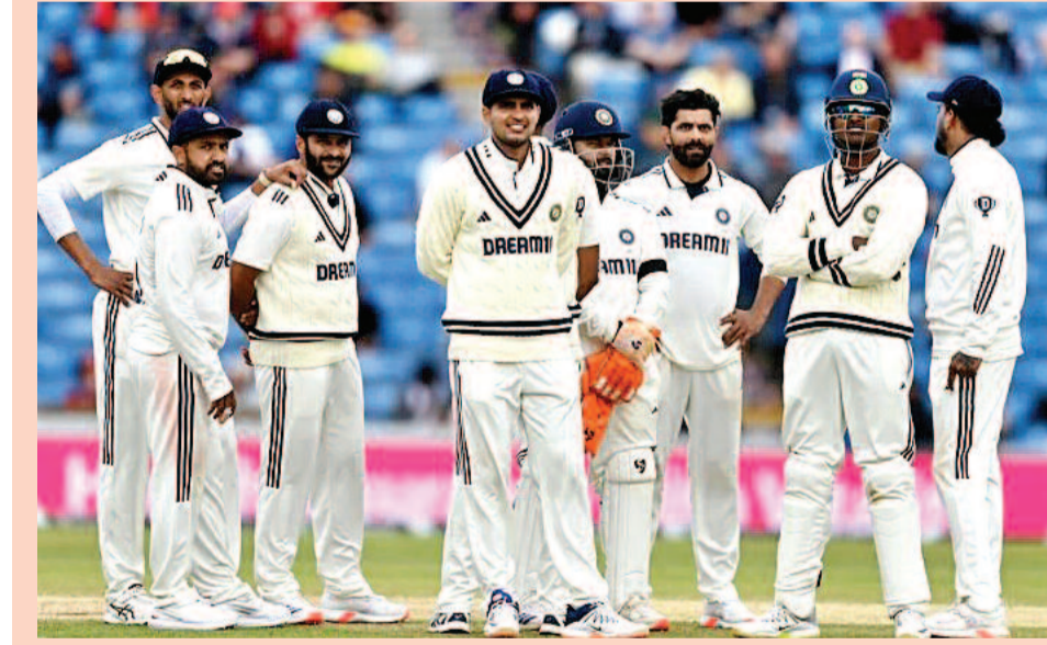
ముంబై, జులై 9: వెస్టిండీస్-శ్రీలంక టెస్టు సిరీస్ ముగిసిన అనంతరం 2025-27 ఐసీసీ వరల్డ్ టెస్ట్ ఛాంపియన్షిప్ తాజా పాయింట్ల పట్టిక విడుదలైంది. ఈ పట్టికలో 87.50 శాతం పాయింట్లతో ఆస్ట్రేలియా అగ్రస్థానంలో కొనసాగుతుండగా, దక్షిణాఫ్రికా రెండో, న్యూజిలాండ్ మూడో స్థానాల్లో నిలిచాయి. 58.33 శాతం పాయింట్లతో బంగ్లాదేశ్ నాలుగో స్థానాన్ని దక్కించుకోగా, భారత్ 48.15 శాతం పాయింట్లతో ఐదో స్థానంలో కొనసాగుతోంది. ఇప్పటివరకు తొమ్మిది టెస్టులు ఆడిన భారత్ జట్టు నాలుగు విజయాలు, నాలుగు పరాజయాలు, ఒక డ్రాతో మొత్తం 52 పాయింట్లు సాధించింది. తాజా పట్టికలో శ్రీలంక ఆరో స్థానంలో ఉండగా, ఇంగ్లాండ్ ఏడో, వెస్టిండీస్ ఎనిమిదో, పాకిస్తాన్ తొమ్మిదో స్థానాల్లో ఉన్నాయి. ఓపెన్ రేట్ నిబంధనల ఉల్లంఘన కారణంగా ఇంగ్లాండ్, పాకిస్తాన్ జట్లకు పాయింట్ల కోత విధించబడింది. డబ్బూటీసీ ఫైనల్ రేసులో నిలవాలంటే భారత్ మిగిలిన టెస్టు సిరీస్లో మెరుగైన ప్రదర్శన చేయాల్సి ఉంది. రాబోయే మ్యాచ్ల ఫలితాలే భారత్ జట్టు ఫైనల్ అవకాశాలను నిర్ణయించనున్నాయి.