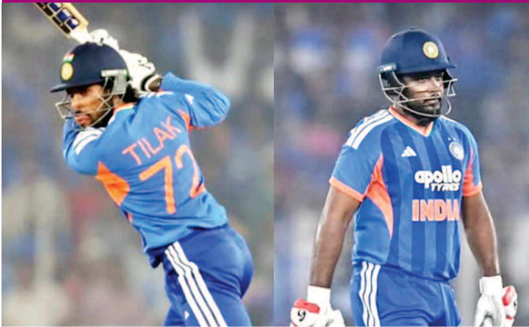
ముంబై, జులై 9: ఇంగ్లండ్తో జరుగుతున్న ఐదు మ్యాచ్ల టీ20 సిరీస్లో వరుస పరాజయాలతో వెనుకబడిన టీమిండియా గురువారం జరిగే నాలుగో మ్యాచ్లో తప్పక గెలవాలనే లక్ష్యంతో బరిలోకి దిగుతోంది. తొలి మ్యాచ్ వర్షం కారణంగా రద్దు కాగా, తర్వాతి రెండు మ్యాచ్లో భారత్ ఓటమిపాలైంది. ప్రస్తుతం ఇంగ్లండ్ 2-0

తొలి స్థానంలో సంజూకు అవకాశం దక్కే సూచనలు