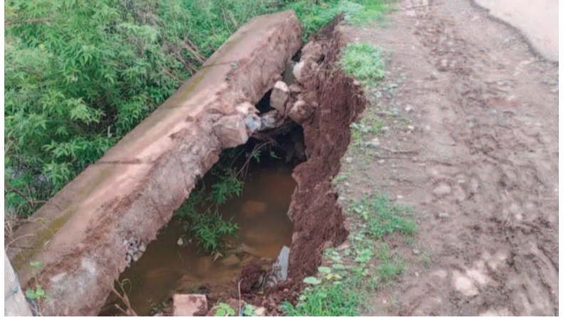
బ్యారికేడ్లు, హెచ్చరిక బోర్డులు పెట్టాలని గ్రామస్థులు డిమాండ్ చేస్తున్నారు. అలాగే రహదారి ఇరువైపులా బలమైన రక్షణ గోడ నిర్మించాలన్నారు. పంచాయతీ రాజ్, ఆర్

దారులు, స్కూల్ బస్సులు ప్రాణాలను అరచేతిలో పెట్టుకుని వెళ్ళాల్సి వస్తోంది. వరాల ఇలాగే కొనసాగితే రోడ్డు పూర్తిగా తెగిపోయి, పరిసర గ్రామాలకు రాకపోకలు నిలిచిపోయే ప్రమాదం ఉందని స్థానికులు భయాందోళనలు వ్యక్తం చేస్తున్నారు. రాత్రి వేళల్లో ప్రమాద తీవ్రత మరింత ఎక్కువగా ఉంటోంది. అధికారులు ఇక్కడ కనీసం బ్యారికేడ్లు, రిఫ్లెక్టర్లు లేదా హెచ్చరిక బోర్డులు కూడా ఏర్పాటు చేయకపోవడంపై స్థానికులు తీవ్ర అసంతృప్తి వ్యక్తం చేస్తున్నారు. ప్రతి ఏటా మట్టి పోసి తాత్కాలికంగా చేతులు దులుపుకుంటున్నారని, శాశ్వత డ్రైనేజీ వ్యవస్థను నిర్మించకపోవడమే దీనికి కారణమని మండిపడుతున్నారు. ఈ నేపథ్యంలో దెబ్బతిన్న కల్వర్లకు వెంటనే అత్యవసర మరమ్మత్తులు చేపట్టాలని, ప్రమాద స్థలంలో తక్షణమే